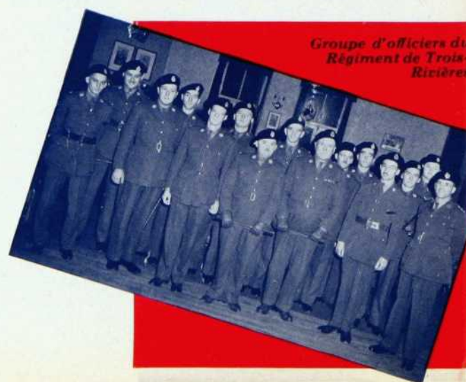
Groupe d'officiers du Régiment des Trois-Rivières