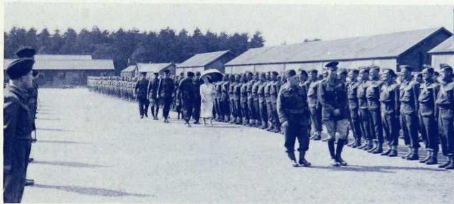
Le Royal 22ème Régiment, en service en Angleterre, est passé en revue par leurs Majestés, le Roi et la Reine, en juin 1940

cent soixante et onze M.M., ainsi que plusieurs autres décorations de pays étrangers.