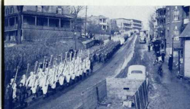
Le régiment "Les Fusiliers de Sherbrooke" revenant de l'exercice