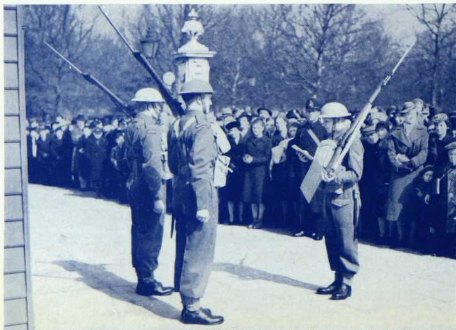
Des soldats du 22ème Régiment écoutent les dernières instructions avant de prendre leur poste de sentinelles devant le palais royal de Buckingham, à Londres, en avril 1940

Après l'armistice, le bataillon se rendit par étapes jusqu'au Rhin et arriva à Bonn, le 5 décembre 1918, où il passa quatre mois avec les troupes d'occupation au milieu de la population allemande.