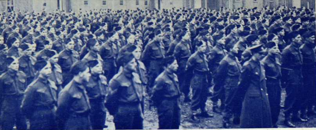
Le Régiment de la Chaudière en entraînement à Sussex, Nouveau-Brunswick, en 1940