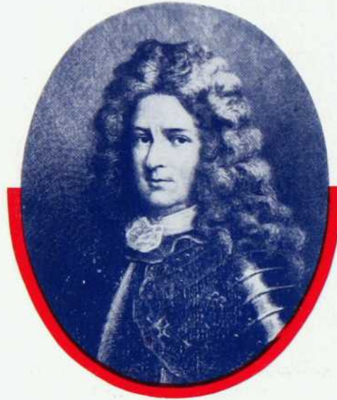
Le Moyne d'Iberville est considéré à juste titre comme l'un des plus grands héros canadiens sous le régime français

Pendant la Guerre d'Indépendance Américaine, les Anglais allaient mesurer cette loyauté. Le gouverneur Carleton fit appel aux Canadiens-français pour défendre le pays. Et, sauf un très petit nombre de partisans de la cause américaine, ils furent un-