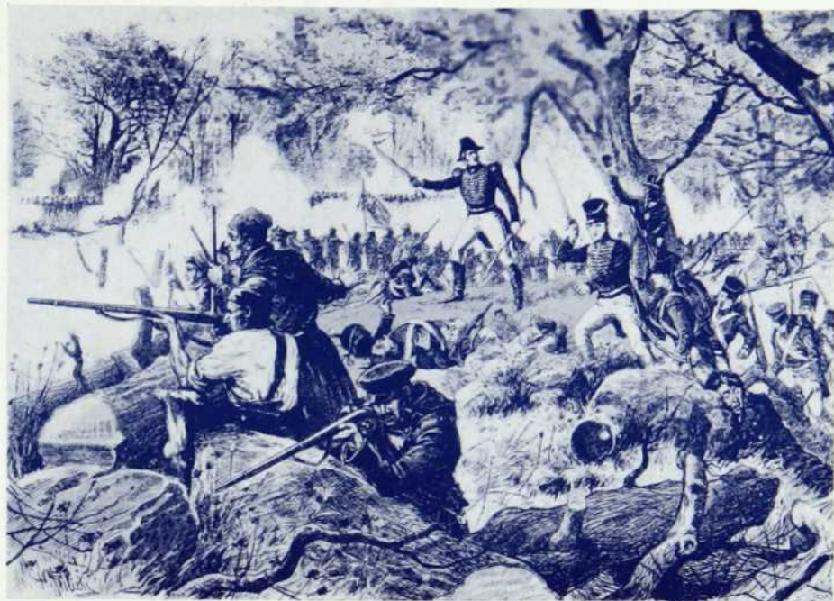
Des troupes canadiennes-françaises, commandées par le vaillant de Salaberry, s'immortalisèrent par leur bravoure à la mémorable bataille de Châteauguay livrée aux Américains en 1812

La guerre contre les Sauvages fut une lutte épique. Les premiers colons avaient un fusil accroché à leur charrue et, la nuit, des hommes veillaient derrière la palissade de fort. Et il arrivait parfois qu'un village fut surpris par les Indiens