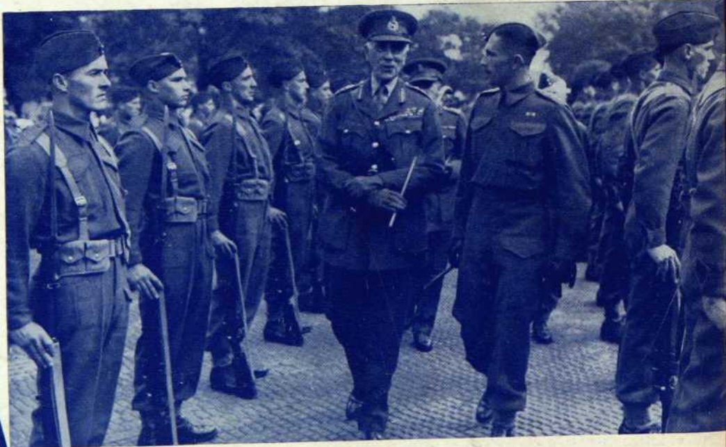
A droite: — Lord Athlone, gouverneur-général du Canada, passant en revue, à son arrivée à Québec, la garde d'honneur fournie par le Régiment de la Chaudière

"Partie au chef de gueules et d'or; les gueules à la gerbe de blé au naturel; l'or à la pioche et à la massue de sable, posées en sautoir; au chevron d'argent chargé de trois poissons au naturel, dont deux se dirigent à senestre et un à dextre; à la pointe d'azur chargée de pin de sinople, accompagné de deux haches de sable posées en sautoir".