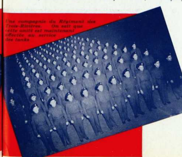
Une compagnie du Régiment des Trois-Rivières. On sait que cette unité est maintenant affectée au service des tanks