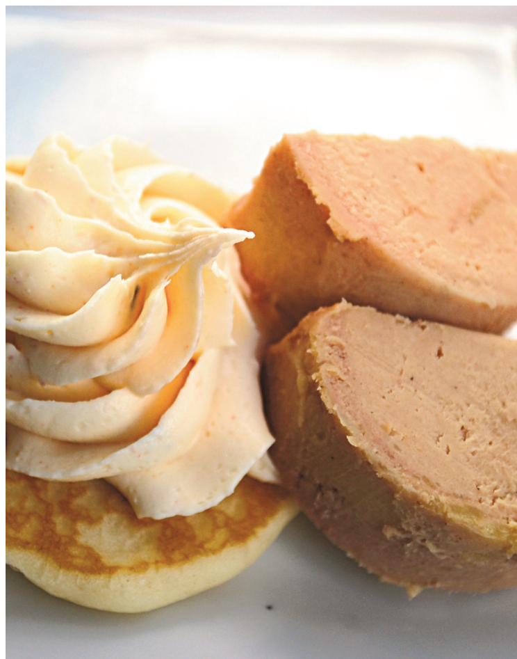
Une mousse de foie gras de canard était servie en demi-lune sur de petits blinis en entrée.

Le Cavalier Maxim n'offre rien de différent de ce qu'on trouve encore dans les restaurants français restés fidèles à une époque passée, mais cela semble plaire à la majorité des convives. Je dis bravo, par contre, pour nous faire découvrir trois fromages d'ici, avant les profiteroles et le café pour conclure ce repas.