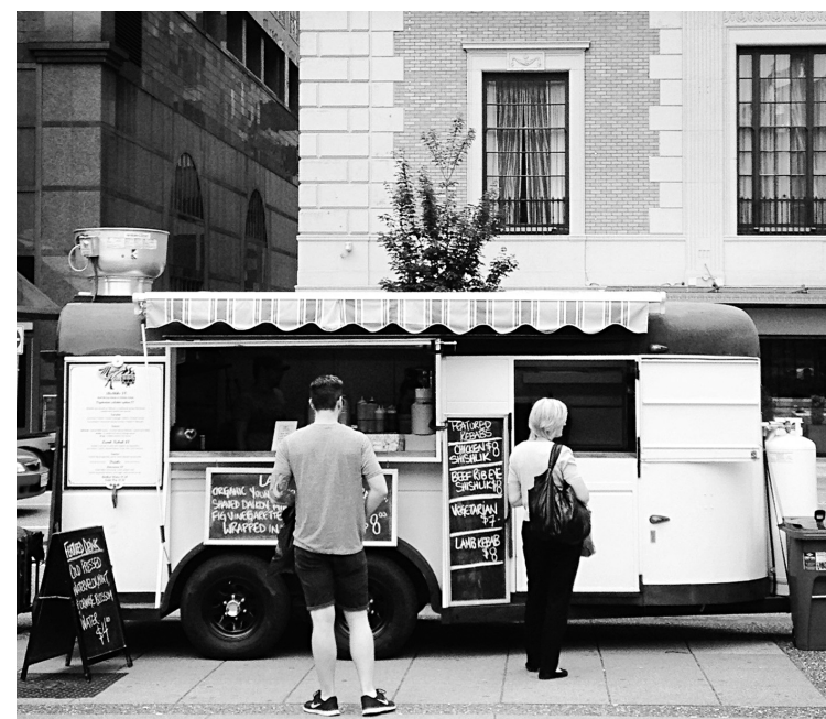
ÉMILIE FOLIE-BOIVIN LE DEVOIR

Avec plus de 130 camions de cuisine de rue, les options pour combler un petit creux ne manquent pas à Vancouver.