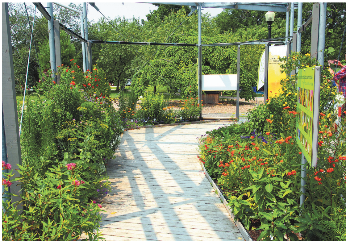
Une certification existe pour les jardins à papillons qui respectent les critères exigés pour devenir une oasis à monarques par le programme « Mon jardin espace pour la vie ».

Les plantes indigènes et horticoles font très bien l'affaire, c'est plutôt une question de choix personnel. Par contre, on doit privilégier les fleurs simples que les papillons reconnaissent aisément et qui sont plus faciles à butiner. Il faut également sélectionner nos plantes afin d'étaler la floraison tout au long de la saison. Les fleurs jaunes et mauves sont leurs préférées, on s'assure donc