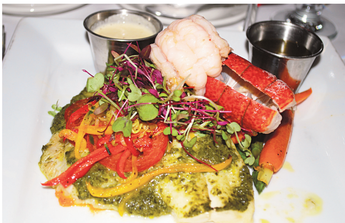
Un des plats principaux proposés à bord du Cavalier Maxim pour la sortie thématique « Un dimanche à Paris » est un filet de sole et homard, une assiette bien garnie et copieuse.

Bourgogne au beurre à l'ail. Ensuite, là non plus rien de très surprenant, on nous a servi une petite salade composée de rondelles de concombre, de roquette et de quelques pousses de maïs jaune.