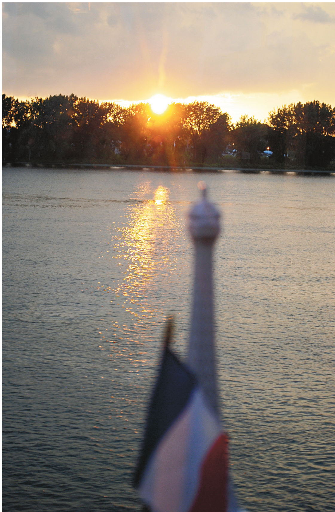
Vue sur le soleil couchant et les îles de Boucherville

Le menu proposé ce soir-là s'inspirait évidemment d'une cuisine française classique, avec une incursion en Nouvelle-France en proposant en plat principal du surf and turf (filet de bœuf et homard). Une mousse de foie gras de canard, sans doute achetée, était servie en demi-lune sur de petits blinis, suivie par quatre escargots en coquilles préparés selon une recette éprouvée et sans surprise, mais vraiment bien réussie: des escargots de