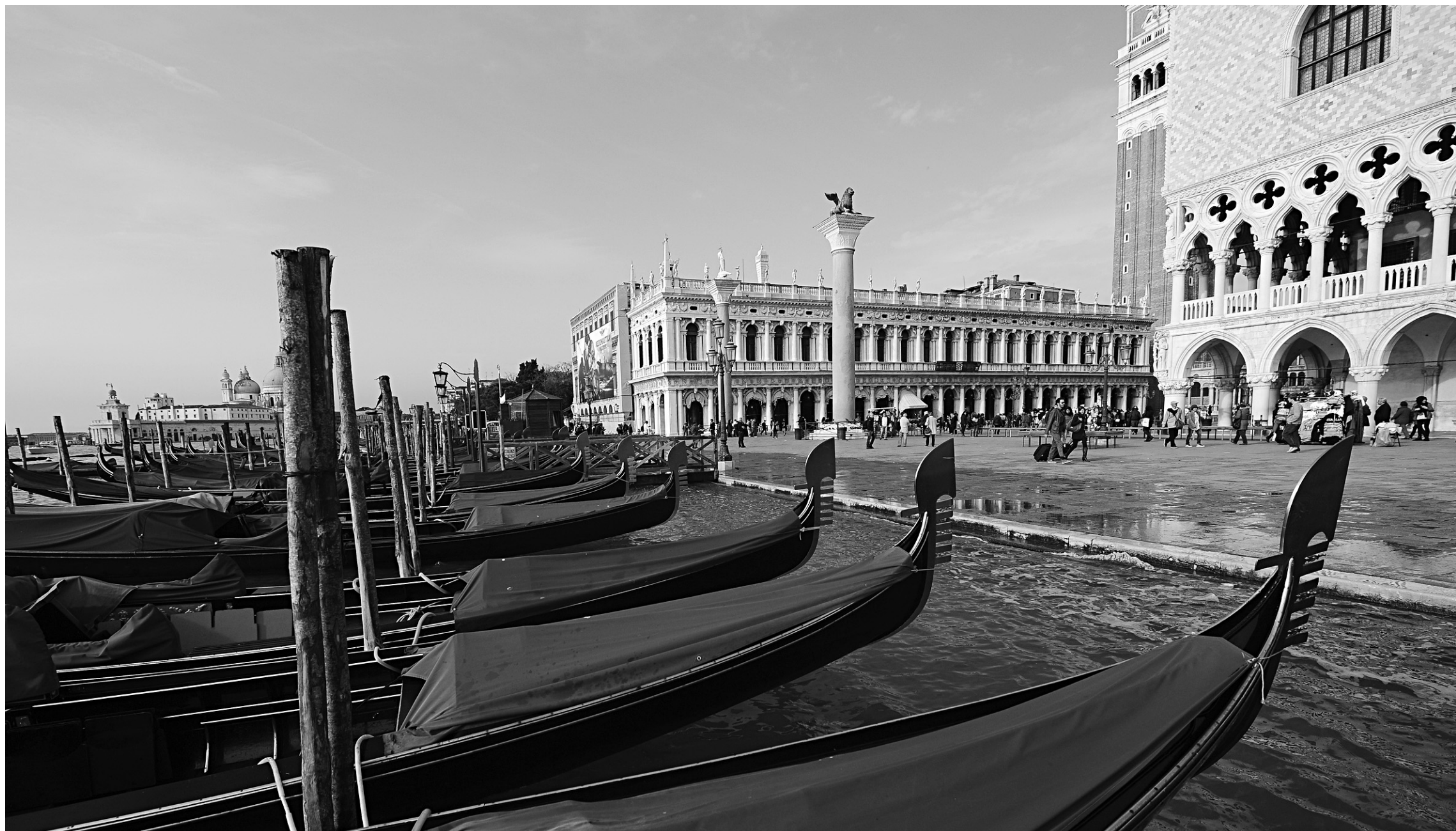
Des gondoles sont amarrées à la place Saint-Marc de Venise.

Le parcours de l'Ombrie et des Marches, en Italie, est moins populaire que ceux de la Toscane ou de la Calabre. Mais il y a aussi moins de touristes et c'est l'occasion de parcourir des villages qui sont autant de petits bijoux.