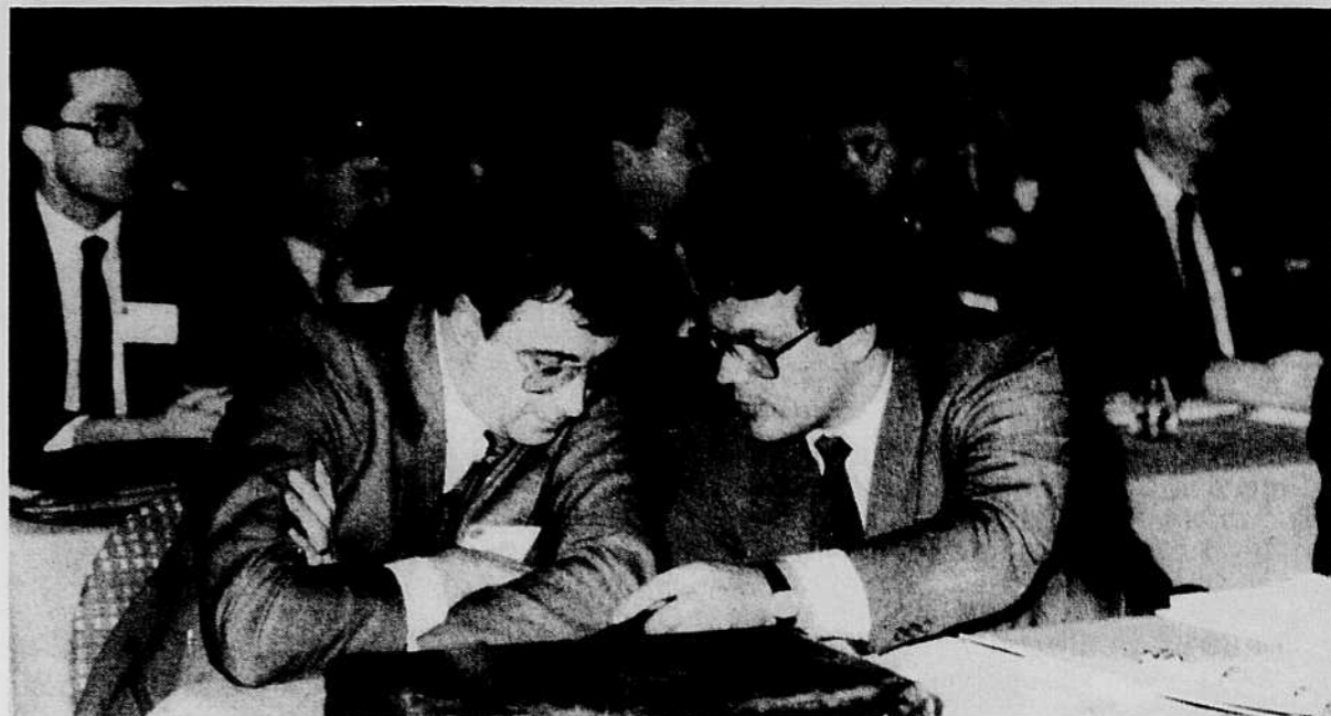
Plus de 200 personnes ont participé au Colloque des gens d'affaires organisé par la Chambre de commerce de Sherbrooke. Les débats passionnés ont été rares, sinon inexistant, mais cela n'a pas empêché la concertation de franchir un pas.

La table du développement technologique a également obtenu la mise en place, par l'Université de Sherbrooke, d'un comité paritaire (formé de chercheurs et de gens d'affaires) chargé surtout de créer des liens encore quasi inexistantes entre l'université et le monde des affaires