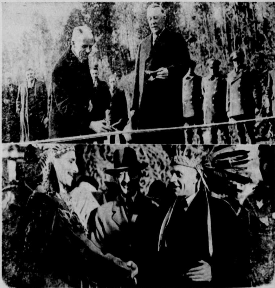
Au cours d'une randonnée de plus de 1,000 milles en Abitibi, à l'occasion de l'inauguration officielle de la nouvelle route Mont-Laurier-Senneterre, le premier ministre de la province, accompagné de trois collègues et d'une nombreuse délégation, a coupé le ruban de la nouvelle route à Grand Remous. On le voit ci-dessus, en train de procéder à cette cérémonie. En bas, M. Godbout a aussi été fait chef Algonquin par la tribu qui habite les environs de Maniwaki. On le voit ici serrer la main du chef Algonquin, qui baptisa M. Godbout "Grand Chef de la province de Québec".