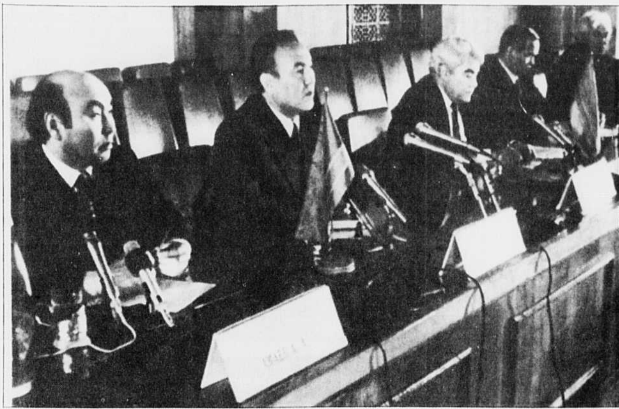
Les présidents des cinq républiques d'Asie centrale en conférence de presse hier.

L'Arménie a déjà annoncé son intention de se rallier à la nouvelle communauté. L'Azerbaïdjan s'y est aussi montré favorable, en soulignant qu'il faisait de l'indépendance sa priorité et n'était nullement pressé d'y adhérer.