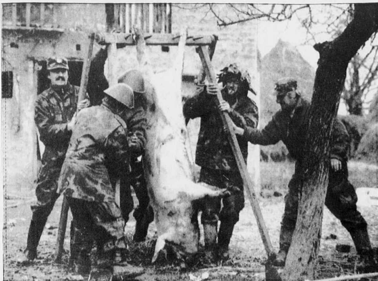
Un groupe de combattants croates se prépare pour le repas du soir sur le front de Nova Gradiska, à 150 km de Zagreb. Le verrat, dit-on, fut victime d'un échange de grenades entre Serbes et Croates.