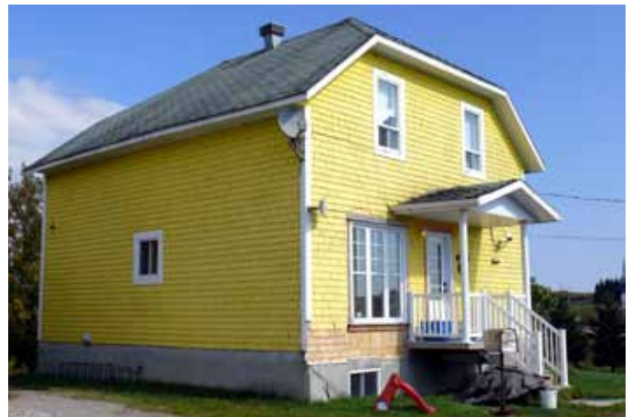
294, chemin Pilote, Saint-Ambroise