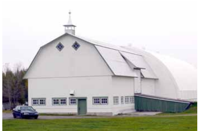
Grange-étable à toit brisé, visible au 1970, rue de l'Hôtel-de-Ville, Saint-Honoré

Avec l'industrialisation des procédés de construction et l'arrivée de nouveaux matériaux, comme le béton, les granges à toit brisé tendront à s'uniformiser au fil des années, tant au niveau de leur volumétrie que des jeux d'angle de la toiture. La grange-étable à toit brisé, moins populaire que celle à pignon droit, demeure tout de même bien présente de nos jours dans le paysage agricole de la MRC du Fjord-du-Saguenay.