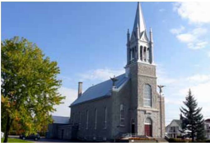
Église de Saint-Honoré, Saint-Honoré