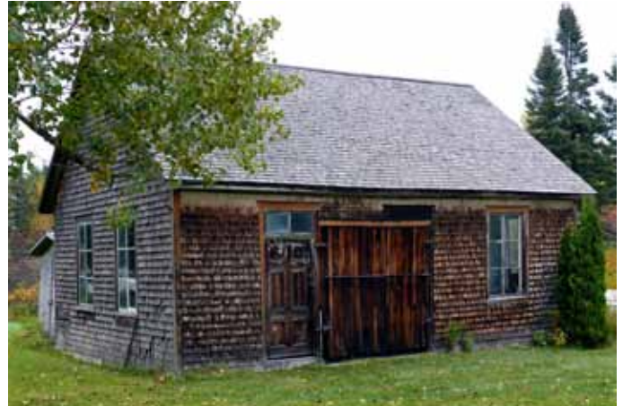
Ancienne école de rang, localisée dans le Rang 2, Saint-Charles-de-Bourget

Dans la MRC du Fjord-du-Saguenay, comme ailleurs au Québec, les premières écoles de rang ont en majorité disparu. Souvent, plusieurs d'entre elles ont été converties en résidence privée, ce qui les rend peu reconnaissables. Pour cette raison, il est possible que certaines anciennes écoles n'aient pas été identifiées. Parmi les rares cas répertoriés, certaines sont dans un très mauvais état, ce qui met en péril leur conservation.