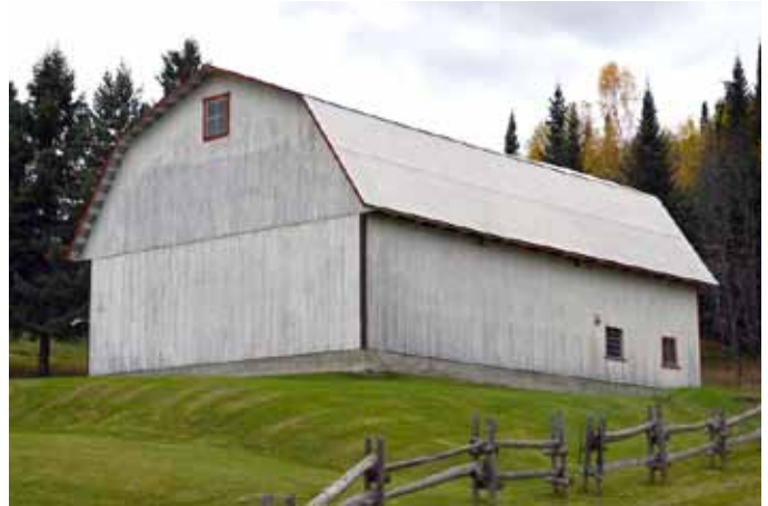
Grange-étable à toit brisé, sise au 610, route 381, Ferland-et-Boilleau