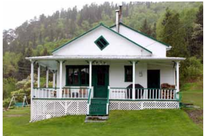
980, rue de la Montagne, Sainte-Rose-du-Nord