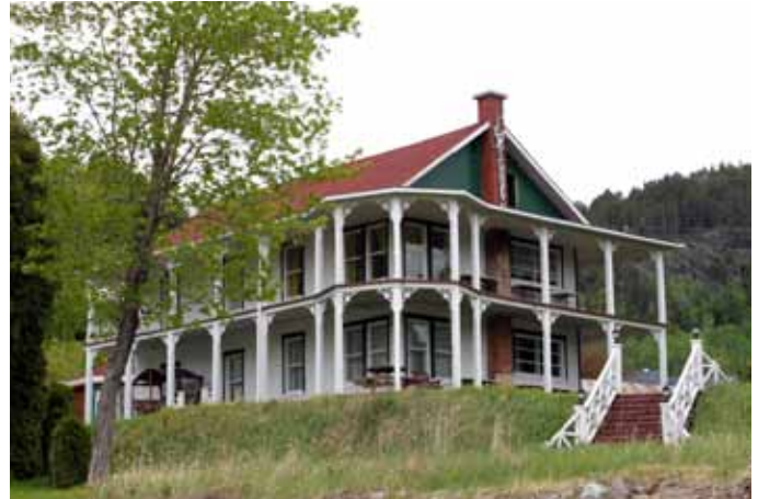
125, rue des Artisans, Sainte-Rose-du-Nord