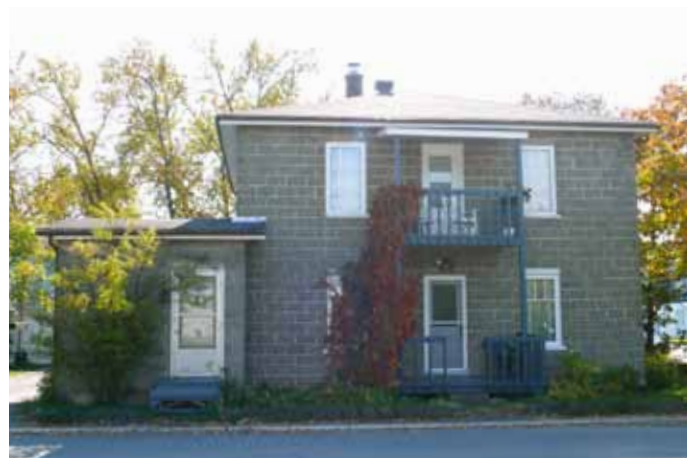
25, rue Pedneault, Saint-Ambroise