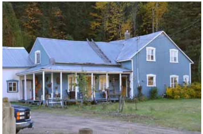
335, chemin Périgny, L'Anse-Saint-Jean