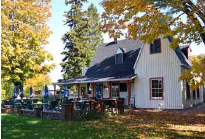
Camp de pêche des Price, L'Anse-Saint-Jean