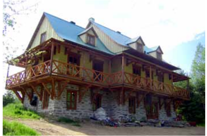
55, rue Dumas, Petit-Saguenay