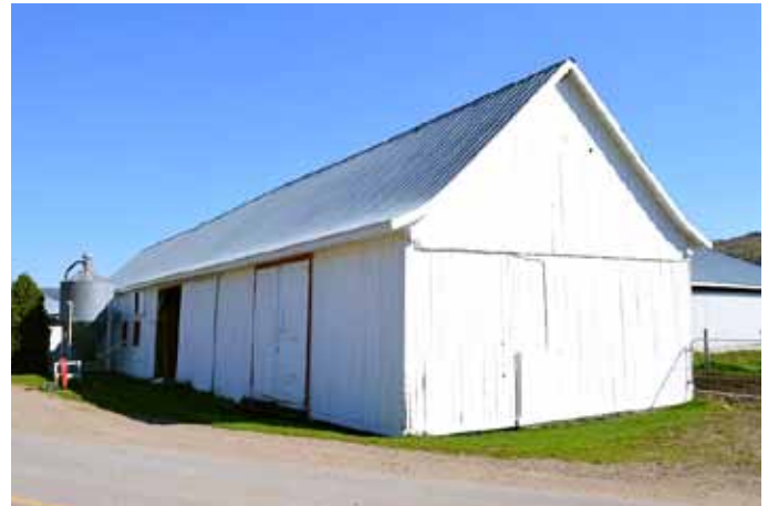
Grange-étable à pignon droit, sise au 6, chemin de l'Anse, L'Anse-Saint-Jean

De loin la plus importante en nombre et en présence dans le paysage rural au Québec, la grange-étable est le bâtiment agricole par excellence de la ferme québécoise. Essentiellement destinée à l'industrie laitière ou à l'élevage bovin, ce type de bâtiment est constitué de deux sections ayant chacun sa fonction : la grange et l'étable. La grange est un bâtiment utilisé pour abriter les récoltes de grain et de foin. L'étable est quant à elle un bâtiment autonome ou une partie fermée à l'intérieur de la grange dans laquelle on loge surtout les bovins. Selon les époques, on peut retrouver greffés à la grange : une écurie, un poulailler, un hangar à fumier, une remise pour la machinerie, un garage pour l'automobile ou un silo. Les granges-étables présentent généralement des plans simples et sont faits de matériaux produits localement, notamment la planche ou le bardeau de bois, ce qui rend leur construction moins coûteuse. De plus, leur ornementation est généralement très sobre. L'utilisation de portes à glissière (sur rail) plutôt qu'à double vantail se généralise au tournant du 20 e siècle, ce type de portes étant moins sujet à des bris lors de forts vents. Dans la MRC du Fjord-du-Saguenay, comme ailleurs au Québec, la grange-étable possède deux variantes principales que sont la toiture à pignon droit et le toit brisé.