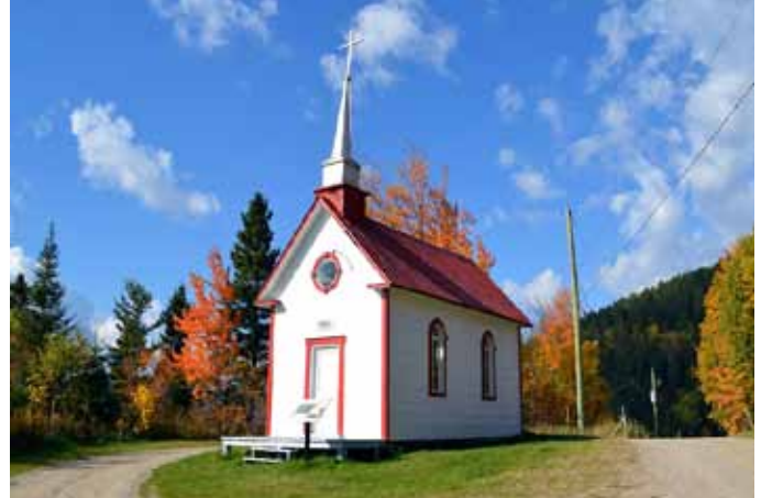
Chapelle de Saint-Basile-du-Tableau, Sainte-Rose-du-Nord

La MRC du Fjord-du-Saguenay possède également quelques chapelles qui ne servent qu'en période estivale sur des sites de villégiature, comme au lac Brochet à Saint-David-de-Falardeau et au lac Larrivée à Saint-Honoré. Ces chapelles modernes n'ont toutefois pas été inventoriées.