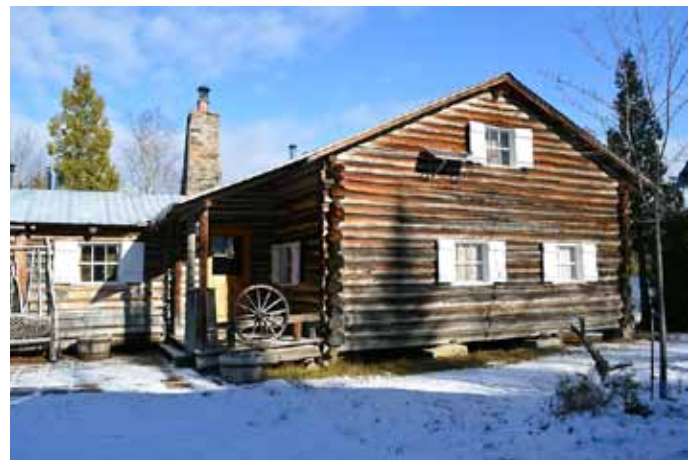
Camp du Lac Brébeuf, Rivière-Éternité