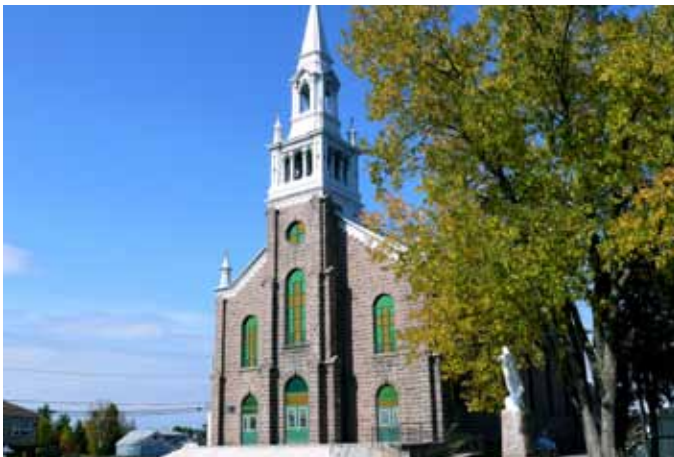
Église de Saint-Ambroise, Saint-Ambroise