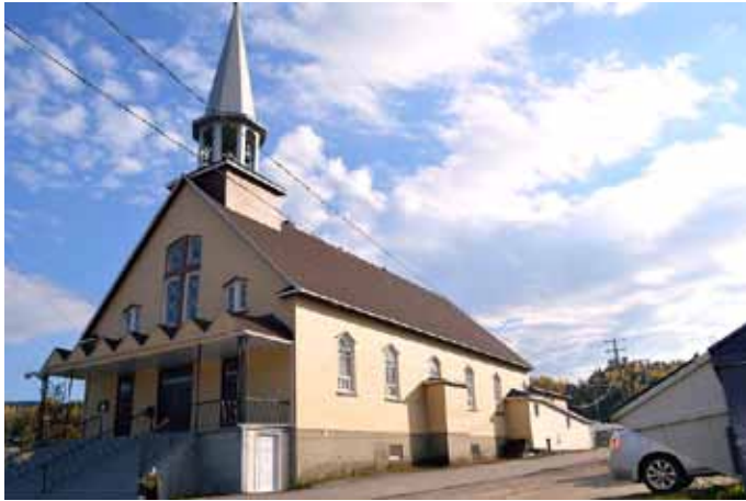
Église de Notre-Dame-de-l'Éternité, Rivière-Éternité