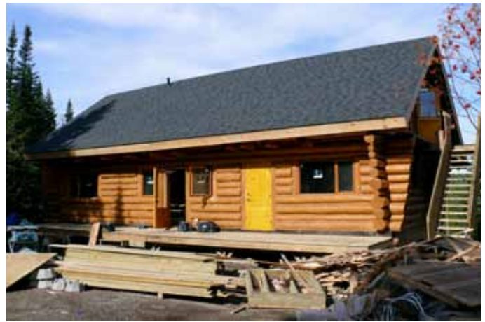
Chalet Antoine-Dubuc, TNO Mont-Valin