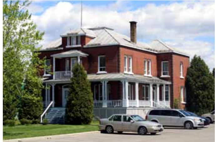
Presbytère de Saint-Honoré, sis au 3560-3562, boulevard Martel, Saint-Honoré