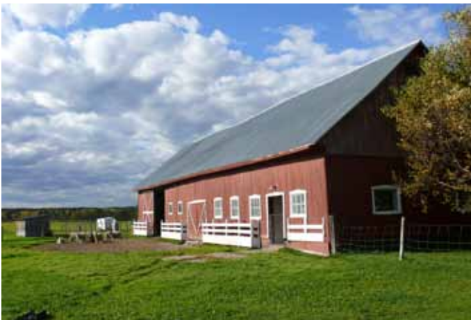
Grange-étable à pignon droit, visible au 71, rang Saint-Joseph, Saint-Fulgence