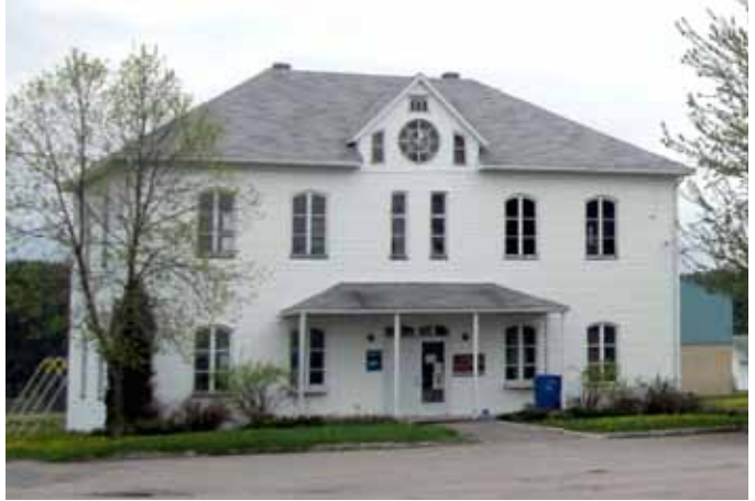
Salle publique de la place des Ormes, Saint-Charles-de-Bourget

Au Québec, plusieurs villages possèdent un couvent qui était autrefois dirigé par des communautés religieuses féminines venues prendre en charge l'éducation des enfants. Les couvents sont habituellement de vastes édifices hauts de plusieurs étages, installés dans le noyau villageois, à proximité de l'église et du presbytère. Ils doivent être suffisamment grands pour accueillir un bon nombre d'élèves des classes élémentaires et secondaires, pour offrir le gîte à plusieurs pensionnaires et pour loger les membres de la communauté. Les deux couvents faisant partie de l'inventaire, situés à Larouche et à Saint-Ambroise, sont des immeubles en brique construits autour de 1950. Ils présentent un toit plat ou à faible pente et des façades relativement dépouillées et percées d'une généreuse fenestration, conformément aux principes de la modernité architecturale. Ces deux immeubles logent aujourd'hui respectivement des organismes communautaires et une école élémentaire.