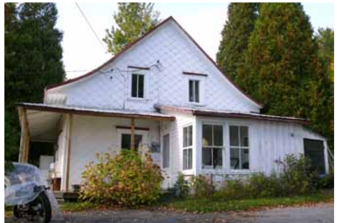
363, rue du Saguenay, Saint-Fulgence