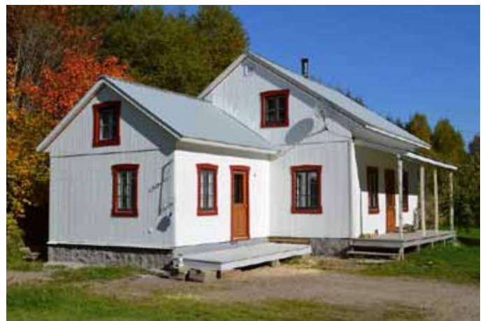
456, chemin Périgny, L'Anse-Saint-Jean