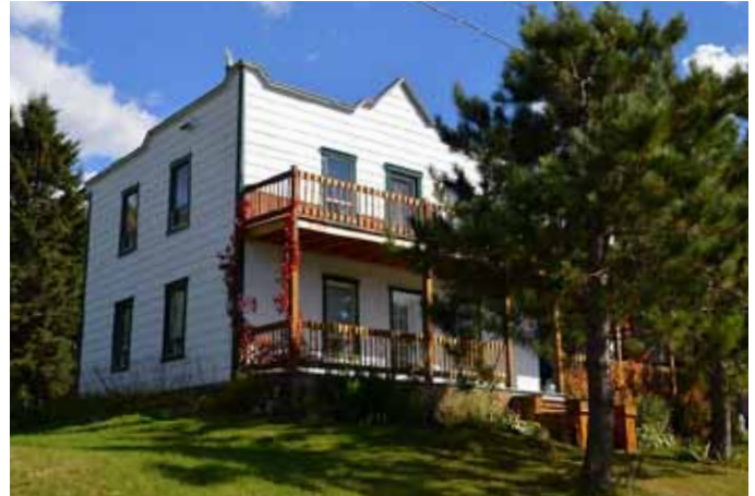
489, rue de la Descente-des-Femmes, Sainte-Rose-du-Nord