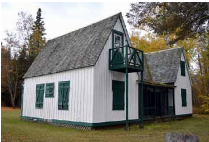
Site de pêche de la pointe de Bardville, TNO Mont-Valin