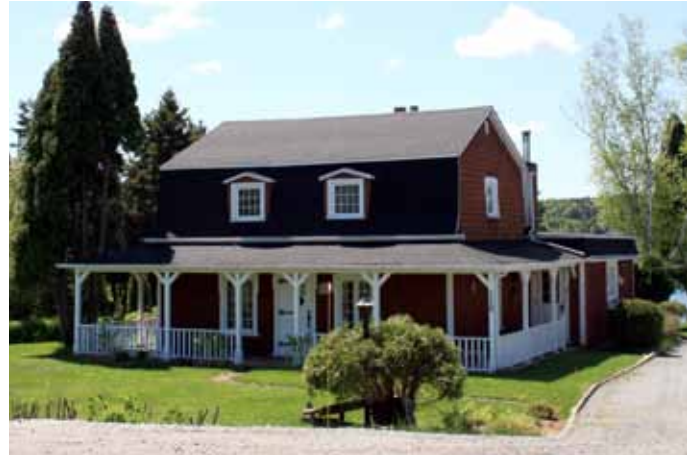
110, chemin Saint-Léonard, Saint-Ambroise