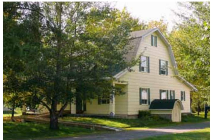
1559, rang des Chutes, Saint-Ambroise