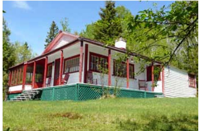
26, chemin du Lac-Laurent, Saint-Fulgence