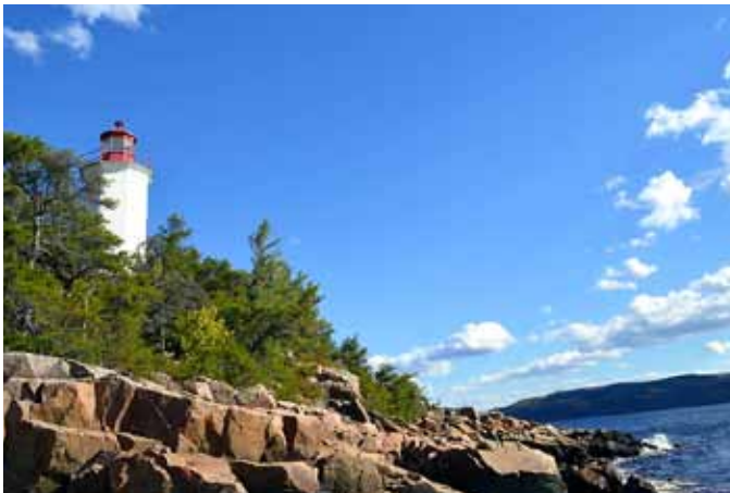
Phare du Cap-à-l'Est, Sainte-Rose-du-Nord

En 1907, le premier feu, installé sur une structure ouverte en bois, est allumé sur les falaises de Sainte-Rose-du-Nord. En 1910, le phare de Cap-à-l'Est est érigé en béton sur l'extrémité sud du cap est. Il s'agit d'une tour octogonale blanche à toit rouge de 33 pieds (10 m) de hauteur portant un feu blanc à éclats qui fonctionne de nuit seulement à longueur d'année. Il a sans doute été installé pour servir aux besoins de la navigation dans le fjord lors du développement industriel de la région et des installations portuaires de Port-Alfred situées au fond de la Baie des Ha! Ha! au début du 20 e siècle.