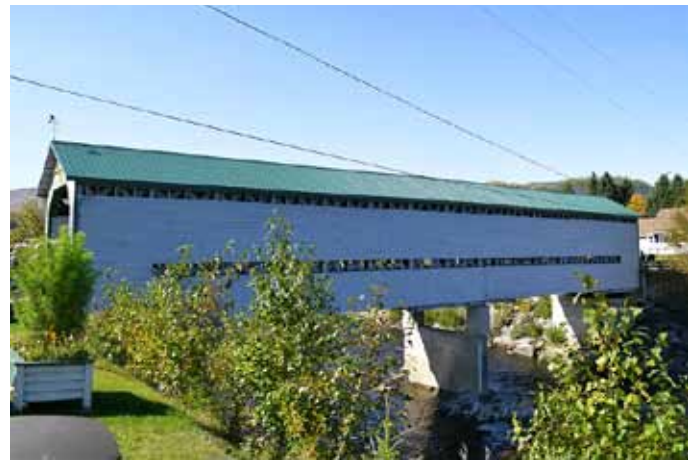
Pont couvert du Faubourg, L'Anse-Saint-Jean