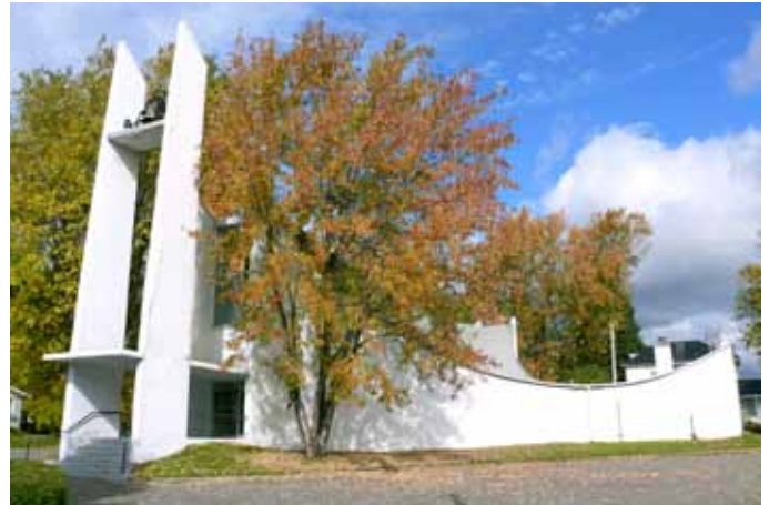
Église de Saint-Gérard-Majella, sise au 656, rue Gauthier, Larouche