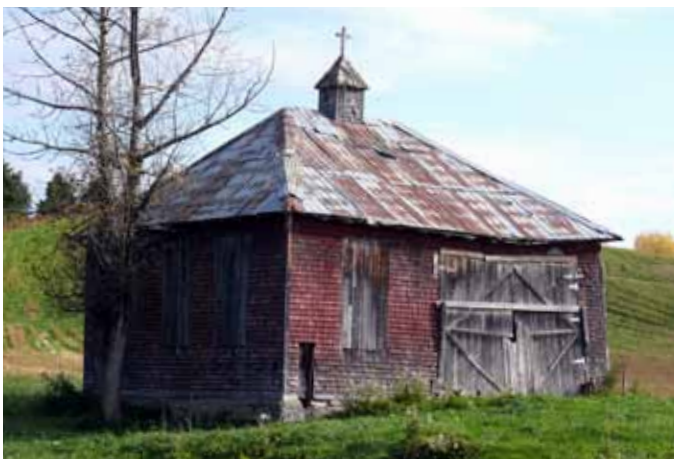
Ancienne école de rang, visible dans le 4 e Rang, Bégin