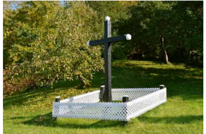
Croix de chemin, L'Anse-Saint-Jean