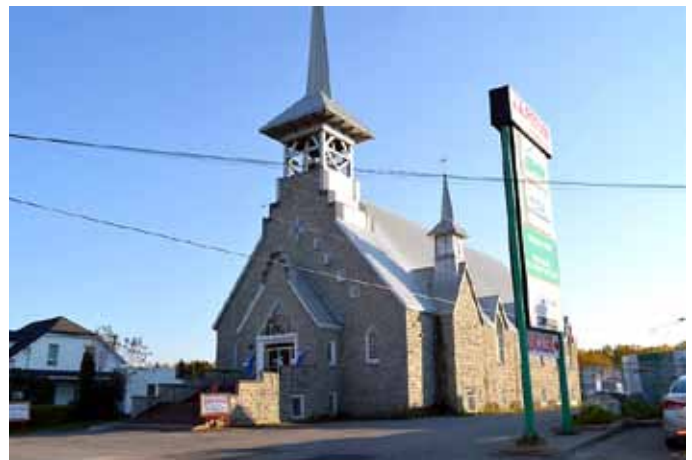
Église de Saint-Félix, Saint-Félix-d'Otis