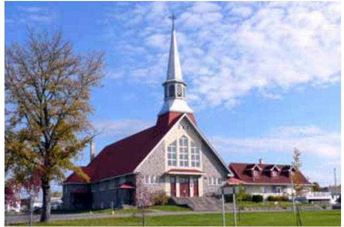
Église de Saint-Jean-l'Évangéliste, Bégin