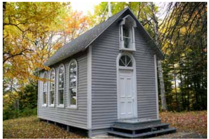
Chapelle Desmeules, Saint-Honoré