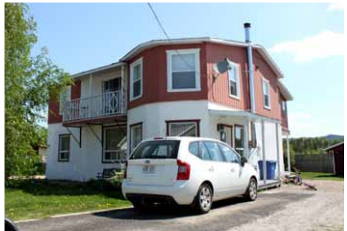
453, route 381, Ferland-et-Boilleau