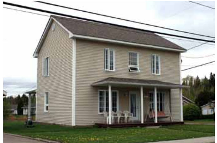
614, rue Gauthier, Larouche