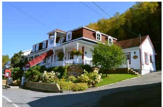
Hôtel Perron, situé au 370, rue Saint-Jean-Baptiste, L'Anse-Saint-Jean