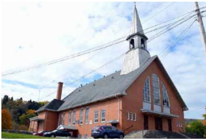
Église de Saint-François-d'Assise, Petit-Saguenay