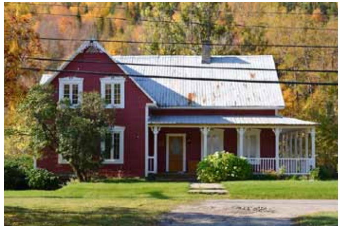
56, rue Dumas, Petit-Saguenay