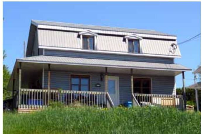
205, rue du Saguenay, Saint-Fulgence