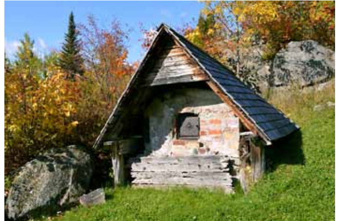
Four à pain, Sainte-Rose-du-Nord

Le four à pain est le témoin de la vie traditionnelle et de l'autosuffisance des habitants du Saguenay. Il resterait une vingtaine de fours à pain seulement sur le territoire de la municipalité de L'Anse-Saint-Jean et plusieurs autres dans l'ensemble des municipalités de la MRC du Fjord-du-Saguenay, surtout dans le Bas-Saguenay. Ces fours à pain n'ont pas tous été répertoriés mais sont souvent identifiés comme bâtiments secondaires de maisons inventoriées.