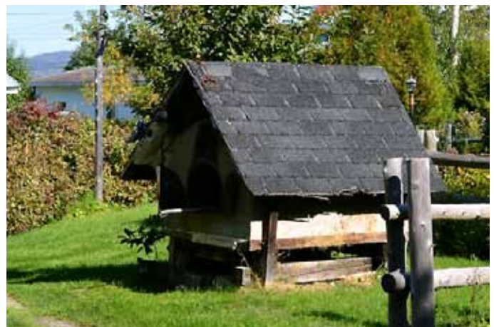
Four à pain, L'Anse-Saint-Jean