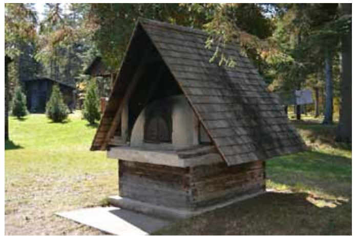
Four à pain, Petit-Saguenay