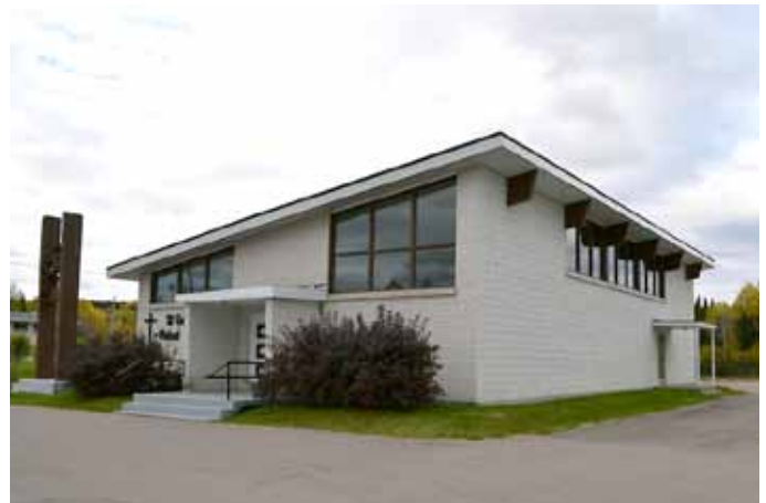
Église de Saint-Gabriel-Lalemant, sise au 466, route 381, Ferland-et-Boilleau