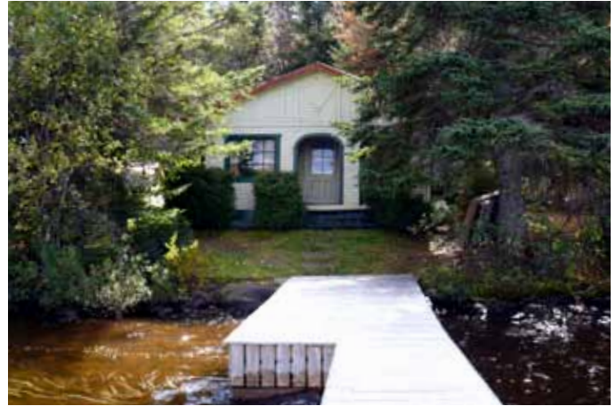
Chalet, chemin du Lac-Laurent, Saint-Fulgence

Tout comme les camps de pêche, les chalets de villégiature sont habituellement en complète harmonie avec la nature. Habituellement situés près d'un lac, d'une rivière ou en montagne, ces chalets utilisent des matériaux naturels tels le bois et la pierre et sont presque toujours dotés de grandes ouvertures et de galeries généreuses, permettant de profiter des attraits naturels environnants. L'inventaire n'a permis d'inventorier que quelques exemples particulièrement bien préservés, notamment au lac Laurent à Saint-Fulgence et au lac des Canots dans le TNO Mont-Valin, dont le chalet Trudel et le chalet Antoine-Dubuc. Ce dernier, cité immeuble patrimonial par la MRC en 2009, est entièrement construit en bois rond vers 1950, une technique particulièrement prisée des villégiateurs de la région.