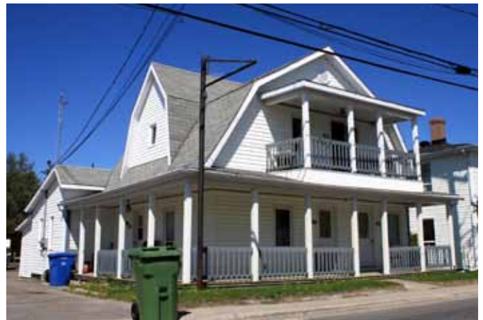
418-422, rue Simard, Saint-Ambroise