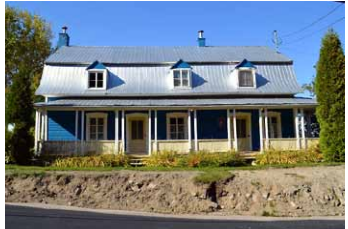
Ancien magasin général Nérée Gagnon, sis au 289, rue Saint-Jean-Baptiste, L'Anse-Saint-Jean.

Quant aux pensions, auberges et hôtels, ils se confondent également souvent avec des résidences. En effet, peu de choses les distinguent de l'architecture résidentielle. La fonction d'accueil de voyageurs et de touristes demande toutefois souvent des agrandissements, ce qui contribue à former, dans certains cas, des complexes hôteliers assez volumineux habituellement situés au centre des villages.