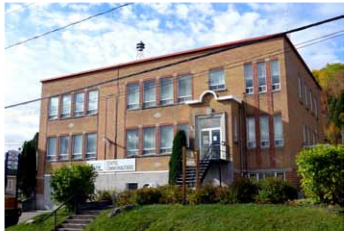
Ancien couvent des Filles de Sainte-Marie-de-la-Présentation, sis au 709, rue Gauthier, Larouche