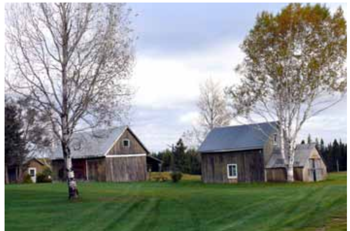
Hangars et remises, Bégin