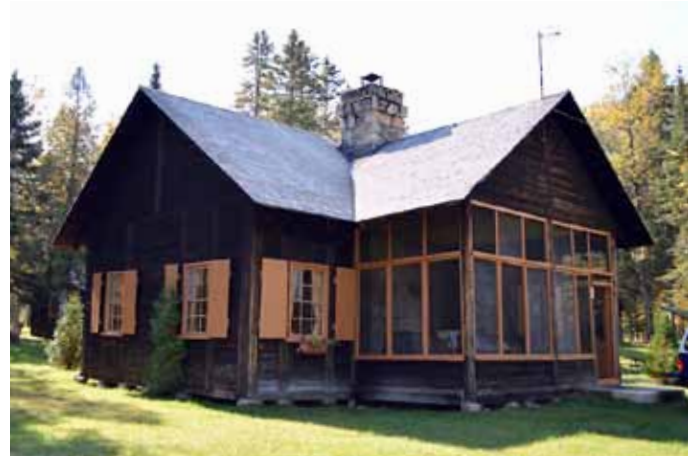
Club des Messieurs, Petit-Saguenay