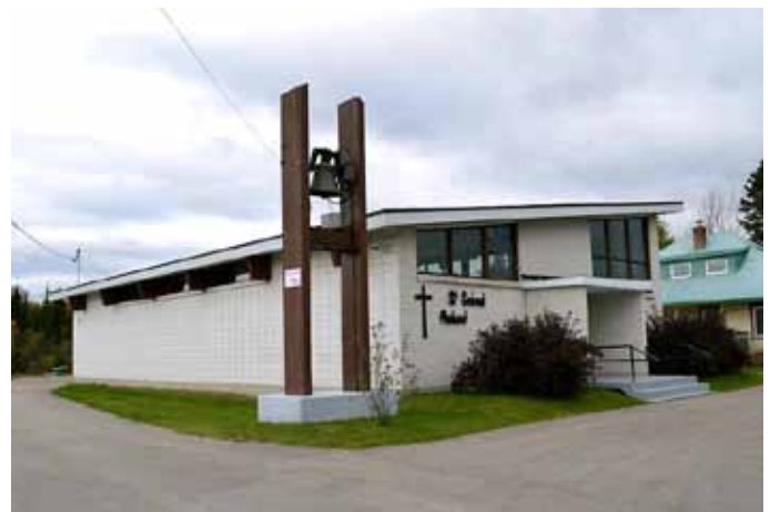
Église de Saint-Gabriel-Lalemant, Ferland-et-Boilleau