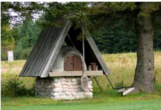
Four à pain, Bégin