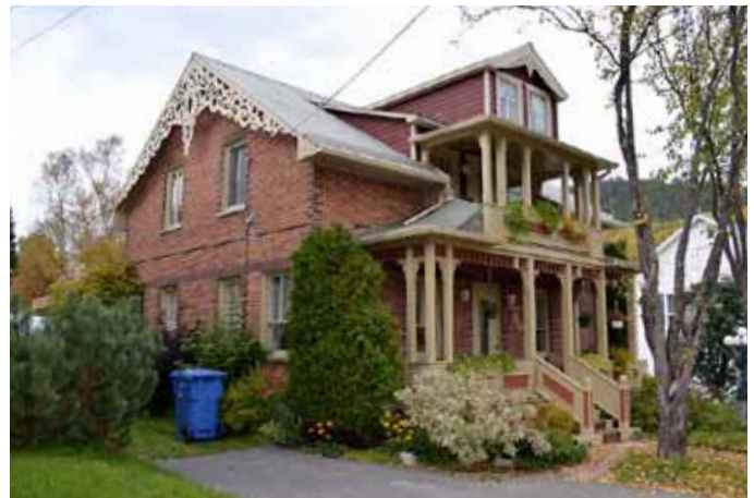
23, rue Tremblay, Petit-Saguenay