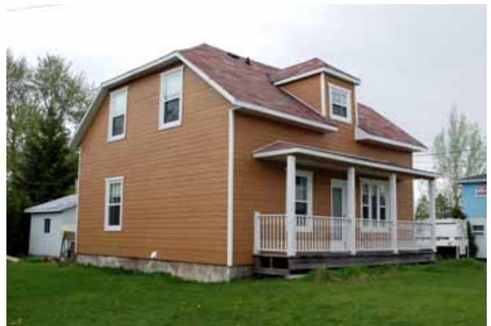
91, rue Parent Nord, Bégoin