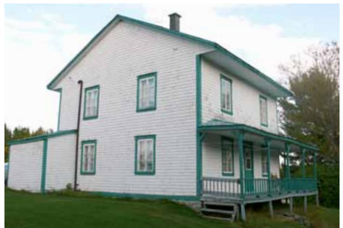
564, 1 er Rang, Saint-Charles-de-Bourget