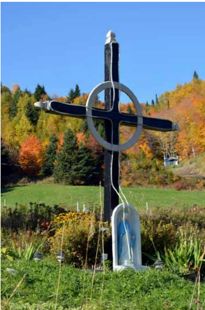
Croix de chemin, L'Anse-Saint-Jean

Les croix de chemin répertoriées dans la MRC du Fjord-du-Saguenay sont peu nombreuses et relativement simples. L'extrémité des pièces de bois peut être taillée ou peinte de couleur contrastante. Par ailleurs, des niches et des clôtures peuvent aussi les distinguer.