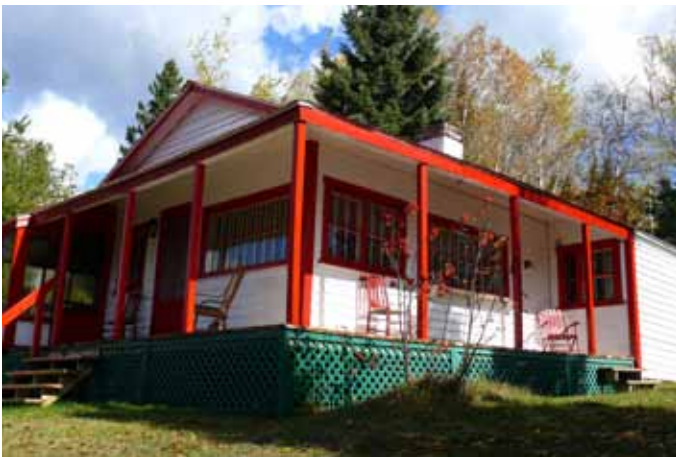
Chalet, chemin du Lac-Laurent, Saint-Fulgence