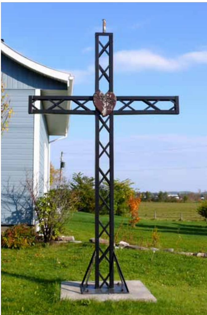
Croix de chemin, Saint-Honoré