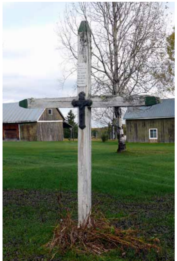
Croix de chemin, Bégin