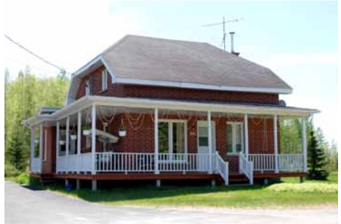
136, 4 e Rang, Saint-David-de-Falardeau