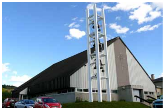
Église de Saint-Fulgence, Saint-Fulgence