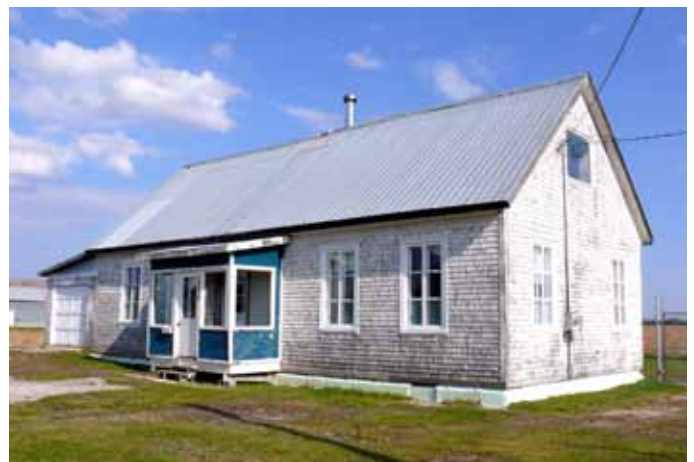
Ancienne école de rang, située dans le rang des Chutes, Saint-Ambroise