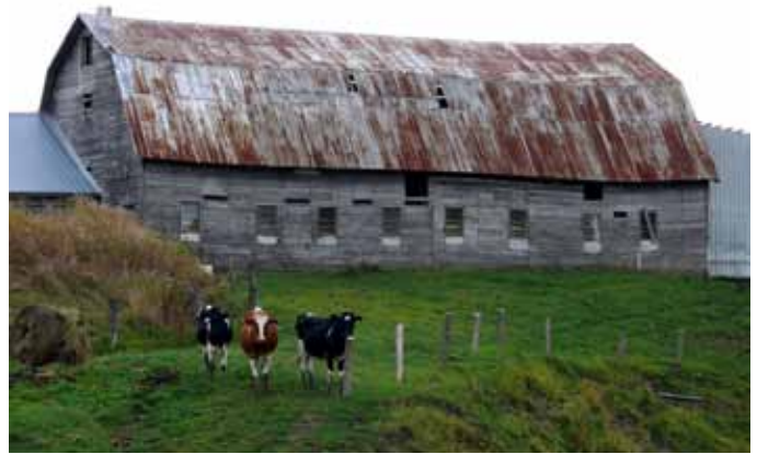
Grange-étable à toit brisé, située au 1293, route Dorval, Larouche

Avec l'industrialisation des procédés de construction et l'arrivée de nouveaux matériaux, comme le béton, les granges à toit brisé tendront à s'uniformiser au fil des années, tant au niveau de leur volumétrie que des jeux d'angle de la toiture. La grange-étable à toit brisé, moins populaire que celle à pignon droit, demeure tout de même bien présente de nos jours dans le paysage agricole de la MRC du Fjord-du-Saguenay.