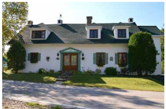
Ancienne école du Pont, localisée aux abords du chemin Saint-Thomas Nord, L'Anse-Saint-Jean