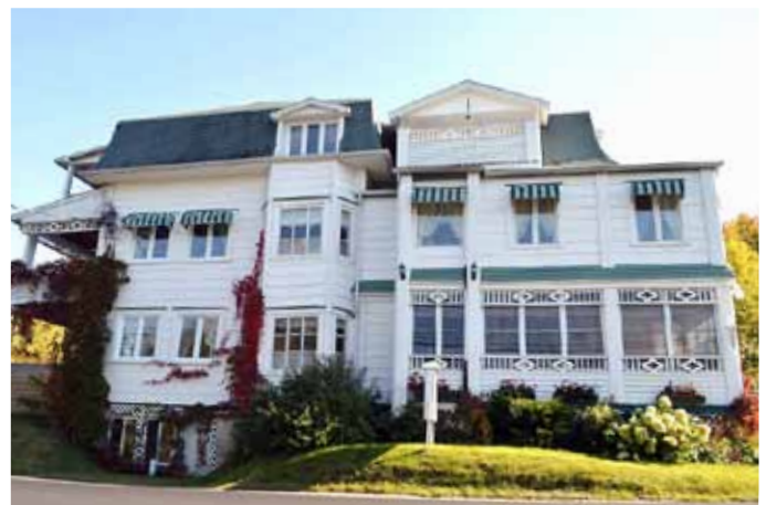
Auberge des Cévennes, sise au 294, rue Saint-Jean-Baptiste, L'Anse-Saint-Jean