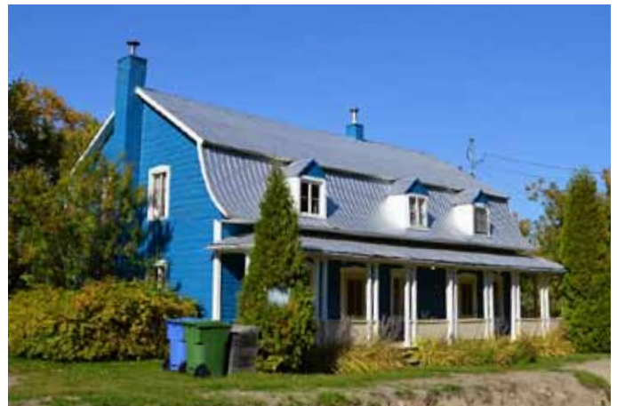
289, rue Saint-Jean-Baptiste, L'Anse-Saint-Jean