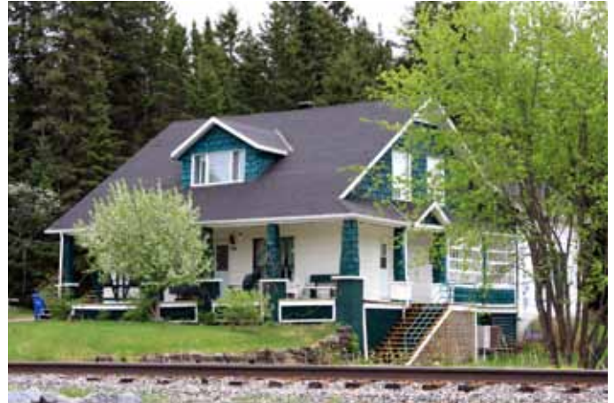
607-609, rue Gauthier, Larouche