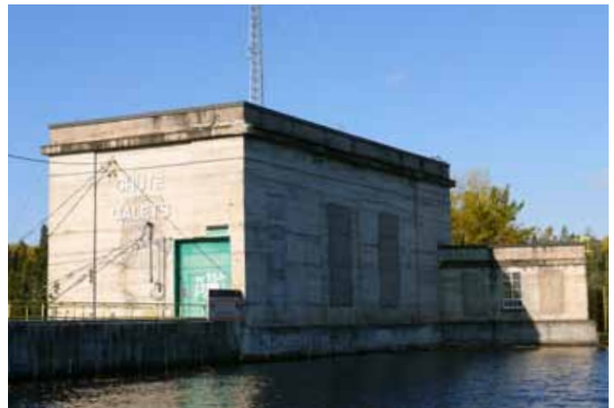
Centrale de la Chute-aux-Galets, accessible par le chemin de la Chute-aux-Galets, Saint-David-de-Falardeau