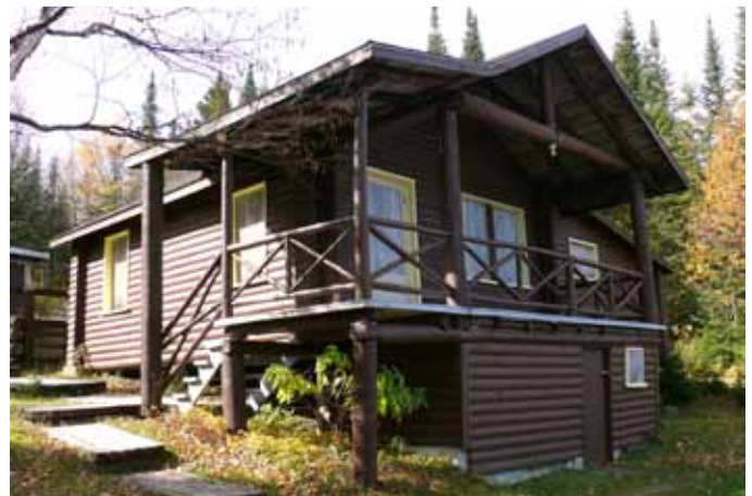
Chalet Trudel, TNO Mont-Valin