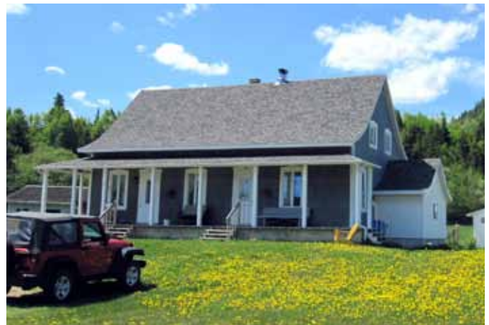
7, chemin de l'Anse, L'Anse-Saint-Jean