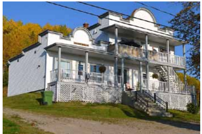
493-497, rue Principale, Saint-Félix-d'Otis