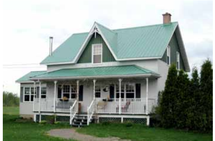
425, 2 e Rang, Saint-Charles-de-Bourget