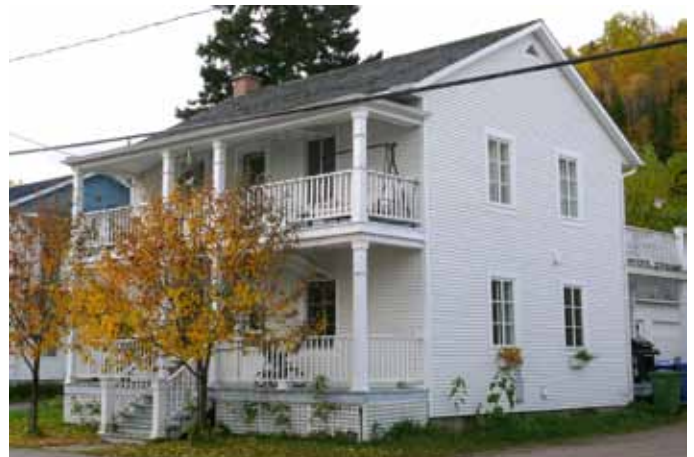
751-753, rue Gauthier, Larouche