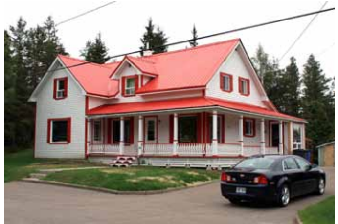
431, chemin des Épinettes, Larouche