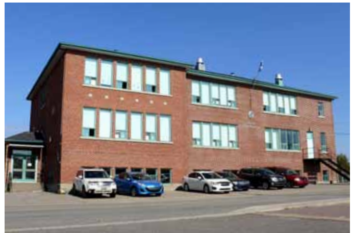
Ancien couvent des Sœurs du Bon-Pasteur, situé au 44, rue du Couvent, Saint-Ambroise