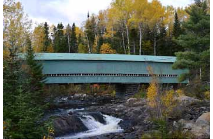
Pont couvert du Lac Ha! Ha!, Ferland-et-Boilleau