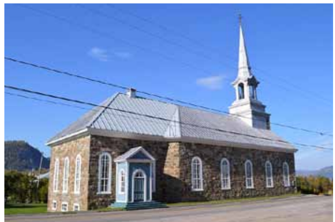
Église de Saint-Jean-Baptiste, L'Anse-Saint-Jean

Les églises de la MRC du Fjord-du-Saguenay se divisent en trois groupes distincts selon leur époque de construction et leur style architectural. Le premier groupe est composé des églises dites traditionnelles qui sont issues de la fin du 19 e et du début du 20 e siècles, soit entre 1889 et 1924. Il s'agit des églises de Saint-Jean-Baptiste de L'Anse-Saint-Jean (David Ouellet, 1889-1890), de Saint-Charles-Borromée de Saint-Charles-de-Bourget (Joseph-Pierre Ouellet, 1915-1916), de Saint-Honoré (Alfred Lamontagne, 1916-1917) et de Saint-Ambroise (Philippe Mayrand, 1922-1924). Elles possèdent toutes un plan rectangulaire et une tour-clocher en saillie au centre de la façade principale. D'une architecture monumentale empruntant au vocabulaire néoclassique, ces vastes lieux de culte sont revêtus de matériaux traditionnels tels la pierre ou le bois. L'ancienne église de Sainte-Rose-de-Lima de Sainte-Rose-du-Nord, datant du 19 e siècle mais reconstruite en 1984 suite à un incendie, peut aussi être rattachée à ce groupe.