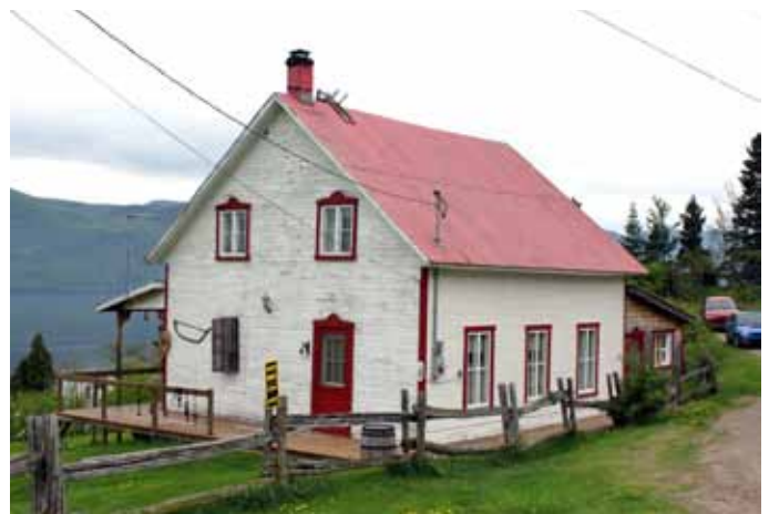
140, chemin du Tableau, Sainte-Rose-du-Nord