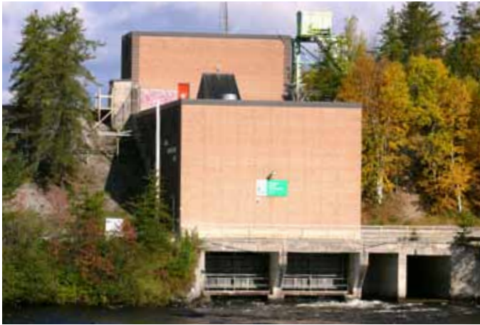
Centrale hydroélectrique Adam-Cunningham, Saint-David-de-Falardeau