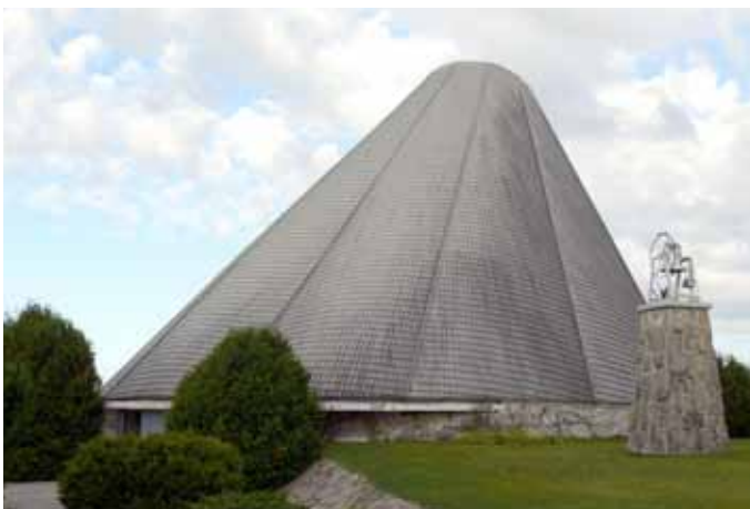
Église de Saint-David, Saint-David-de-Falardeau