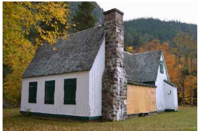
Pavillon d'accueil du site de pêche de Bardville, accessible par la route 172, TNO Mont-Valin