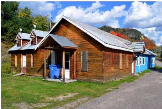
Ancienne scierie, située sur la rue des Artisans, Sainte-Rose-du-Nord

Dans les petites communautés, les bâtiments à usage industriel se démarquent habituellement peu de l'architecture domestique. Qu'il s'agisse d'un moulin, d'une scierie, d'une forge, les courants architecturaux sont les mêmes et les formes bâties se distinguent peu des résidences environnantes. Par ailleurs, le caractère éphémère et utilitaire de certaines fonctions industrielles fait en sorte que bien souvent, les bâtiments disparaissent ou sont radicalement transformés lorsque l'usage initial prend fin. Les fonctions comme les forges ou les moulins artisanaux sont souvent disparues tandis que certains bâtiments (laiteries, beurreries, fromageries, ferblanteries, menuiseries) ont été recyclés à des fins résidentielles sans que les traces de leur ancien usage aient survécues. C'est pourquoi le présent inventaire comprend peu de bâtiments industriels.