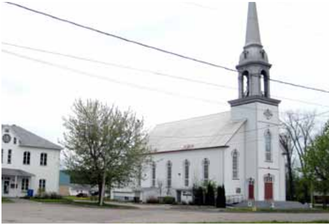
Église de Saint-Charles-Borromée, Saint-Charles-de-Bourget