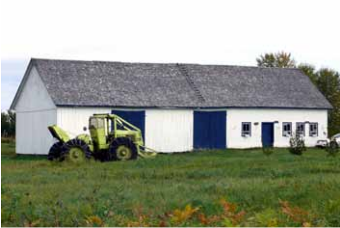
Grange-étable à pignon droit, située au, 674, 2 e Rang Ouest, Bégin