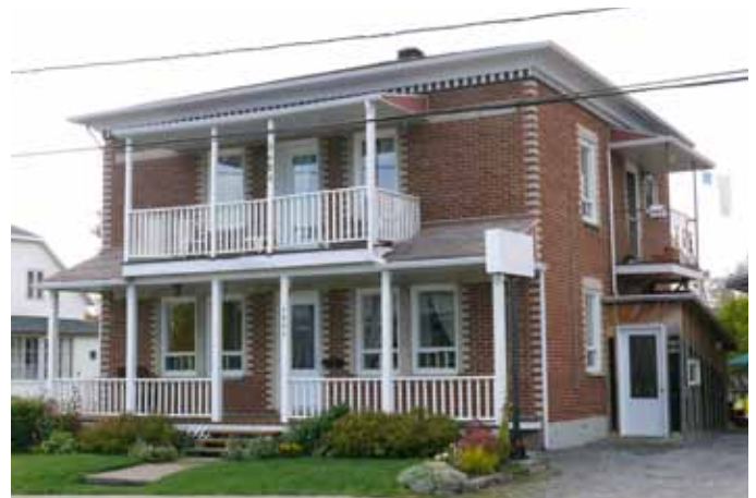
3681-3683, boulevard Martel, Saint-Honoré