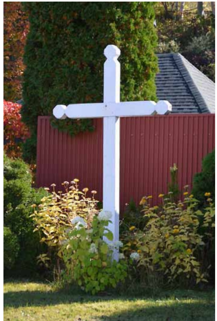
Croix de chemin, L'Anse-Saint-Jean