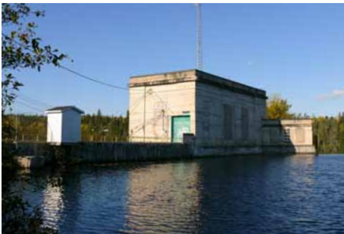
Centrale hydroélectrique de la Chute-aux-Galets, Saint-David-de-Falardeau