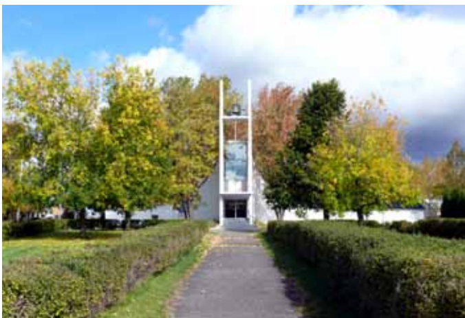
Église de Saint-Gérard-Majella, Larouche

églises. Les deux cas les plus remarquables dans la MRC du Fjord-du-Saguenay sont l'église de Saint-Gérard-Majella de Larouche (Saint-Gelais & Tremblay, 1960) avec son plan en forme de croix coiffé d'un grand voile de béton et l'église de Saint-David de Saint-David-de-Falardeau (Desgagnés & Côté, 1967) en forme de cône tronqué. L'intérêt architectural de ces deux temples dépasse la région et font partie du patrimoine moderne québécois. Deux autres églises, moins audacieuses, font également partie de ce groupe : l'église de Saint-Gabriel-Lalemant de Ferland-et-Boilleau (1970) et l'église de Saint-Fulgence (1980). Ces églises représentent leur époque sans toutefois se démarquer d'un point de vue architectural.