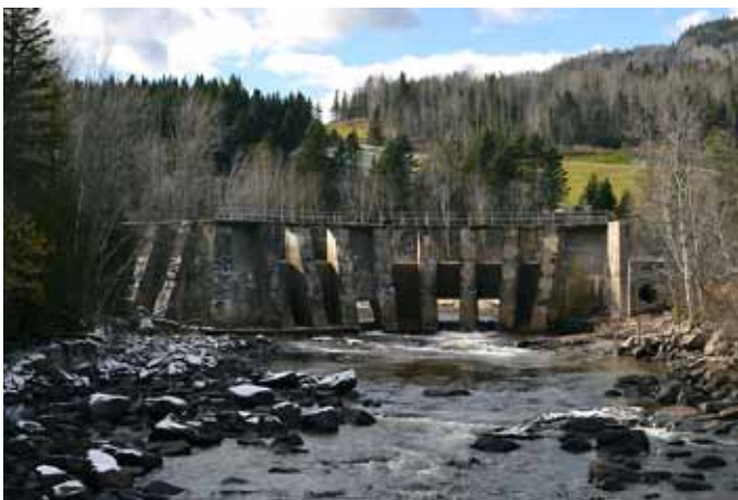
Barrage du Petit-Saguenay, Petit-Saguenay