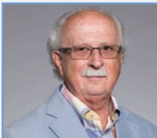
Richelieu Jacques Hébert