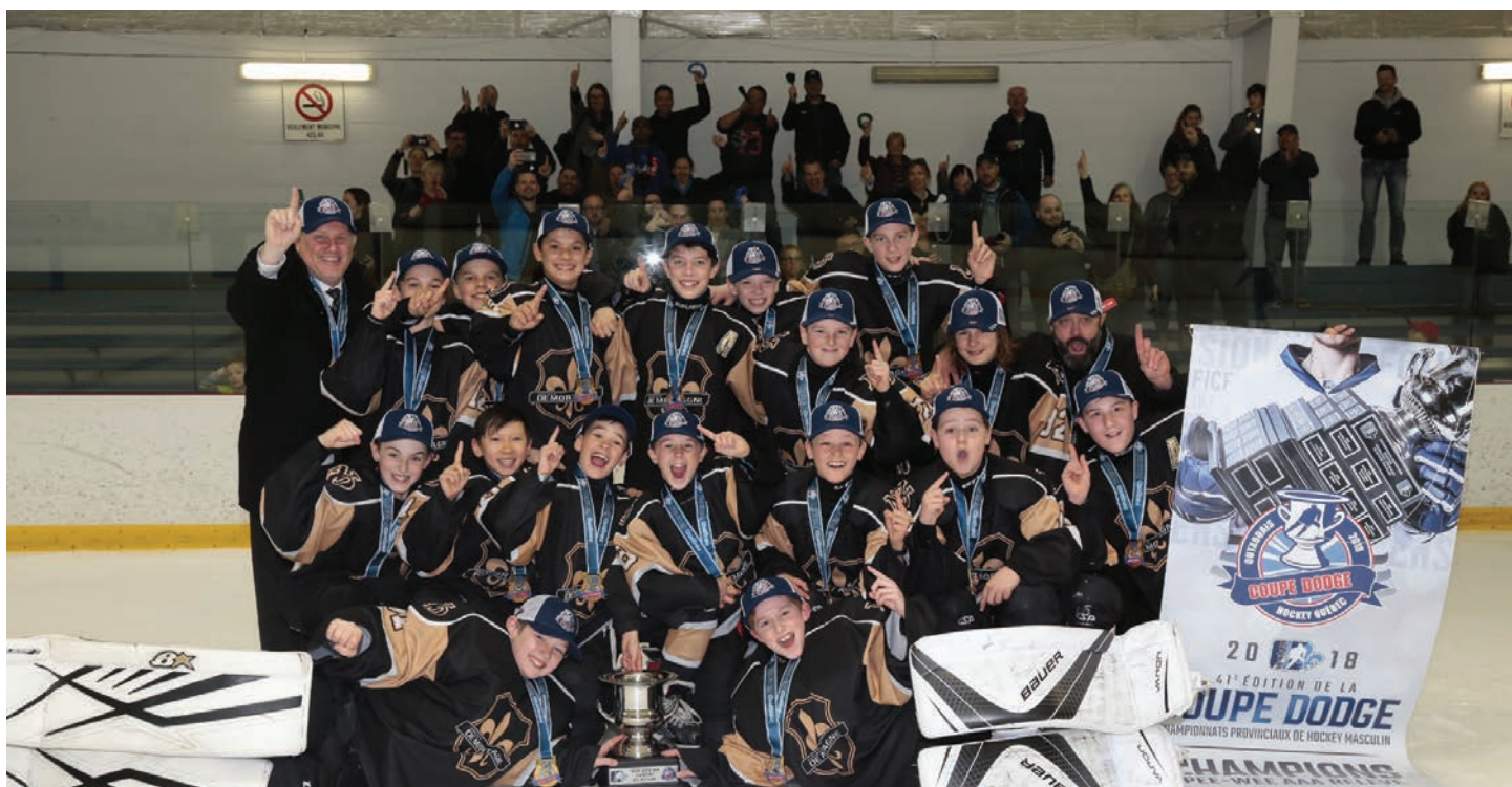
Noir et Or du Richelieu, gagnant de la Coupe Dodge 2018, volet masculin, Pee-ween AAA Relève