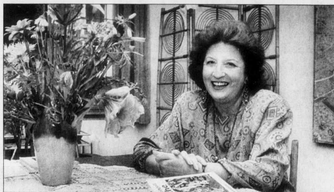
La comédienne écrivait aussi; notre photo a été prise en 1990 lors du lancement de Jacinthe .

(AP) — Le prix du jury du Festival de Sundance a été attribué ce week-end à The Believer , écrit et réalisé par Henry Bean, film poignant et sombre sur un jeune juif qui rejoint les milieux néonazis. Après 11 jours de projections, les jurés de Sundance ont également décerné samedi soir des prix d'interprétation spéciaux à Sissy Spacek et Tom Wilkinson pour leur performance dans In The Bedroom , dans lequel ils jouent des parents frappés par une tragédie familiale. Le prix du public a été décerné à Hedwig And The Angry Inch , comédie musicale adaptée d'un spectacle off-Broadway. Ce film a également valu le prix de la réalisation dramatique à John Cameron Mitchell. Le prix du scénario a été remporté par Christopher Nolan pour Memento , un thriller sorti à l'automne en France, et le prix du cinéma international a été accordé à The Roadhome de Zhang Yimou.