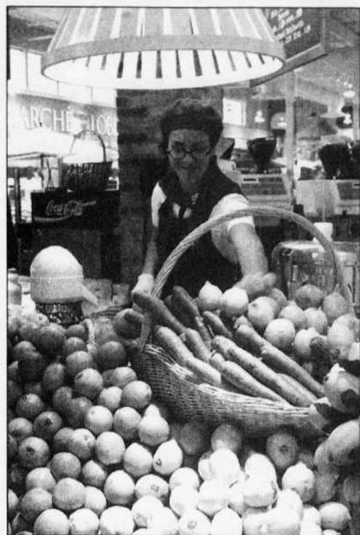
Les marchands devraient être plus enclins à s'assurer que l'étiquetage de leurs produits soit rigoureusement exact.