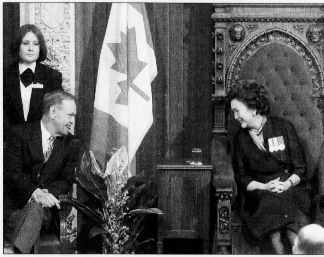
La gouverneure générale, Adrienne Clarkson, et le premier ministre Jean Chrétien échangent quelques bons mots peu avant qu'elle ne lise le discours du Trône.

Ainsi, il estime que le gouvernement Chrétien au-