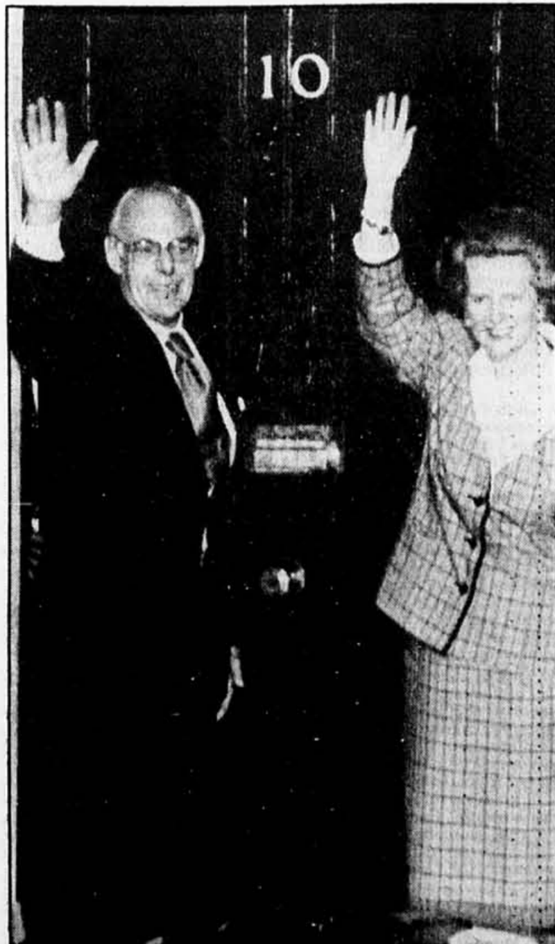
Margaret Thatcher et son mari, Denis, rentrent au 10 Downing Street après une nouvelle victoire électorale.

M. Parkinson est considéré comme le dauphin du premier ministre. Sa nomination au ministère de l'Énergie est considérée comme un nouveau point de départ pour M. Parkinson, un thatcheriste convaincu de 56 ans, ancien président du Parti conservateur. Un point de départ vers les plus hautes fonctions de l'État britannique, croient plusieurs.