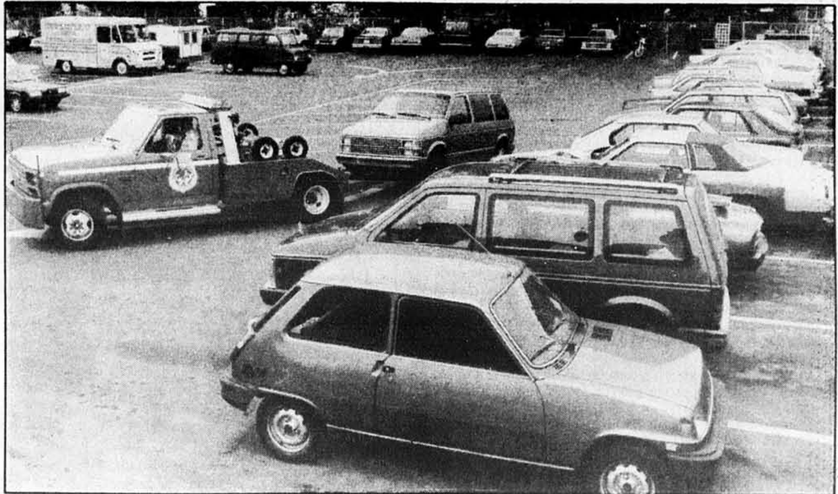
Les associations de protection des consommateurs se plaignent que les frais sont trop élevés et les fourrières privées trop éloignées. On voit ici celle de l'entreprise Remorquage Québécois, à Rosemont.

Le débat est maintenant devant les tribunaux