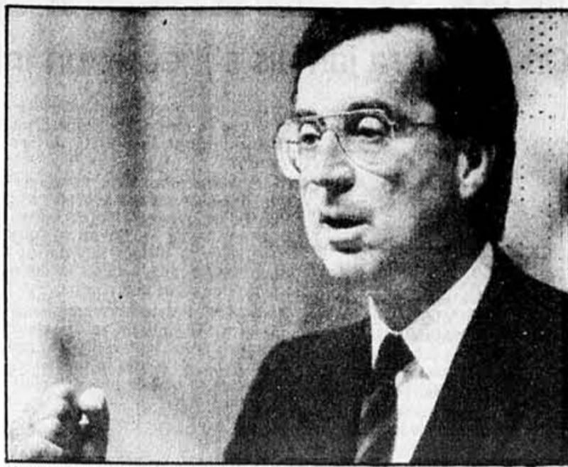
Une urgence qui permettrait d'envoyer rapidement un message clair au Canada anglais?

■ Qui sait si Howard Pawley n'est pas tenté de vérifier ce que pensent les Manitobains de son interprétation néo-démocrate du