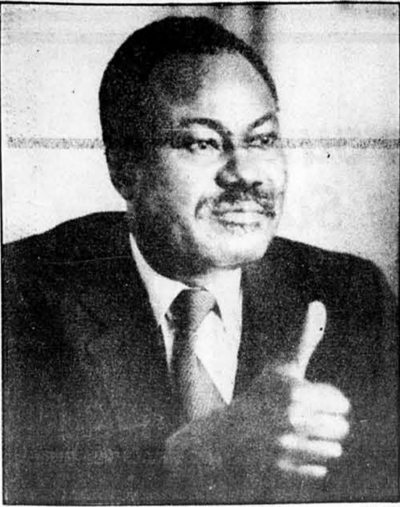
Mose Mensah, candidat à la direction de la FAO.

S'il doit représenter toutes les tendances présentes parmi les 158 pays membres de la FAO, il n'aboutira qu'à la paralysie générale.