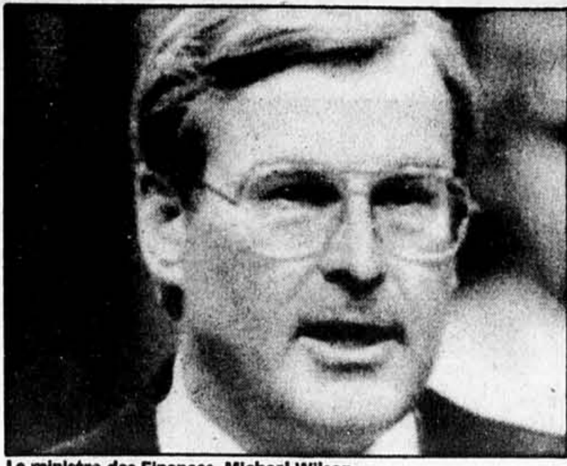
Le ministre des Finances, Michael Wilson.

Par contre, des sondages encore négatifs pour le parti ministériel pourraient amener à retarder le scrutin au printemps de l'année suivante. Dans ce cas, l'équipe conservatrice réserve une autre agréable surprise pour le contribuable. Le remboursement d'impôt du printemps 1989