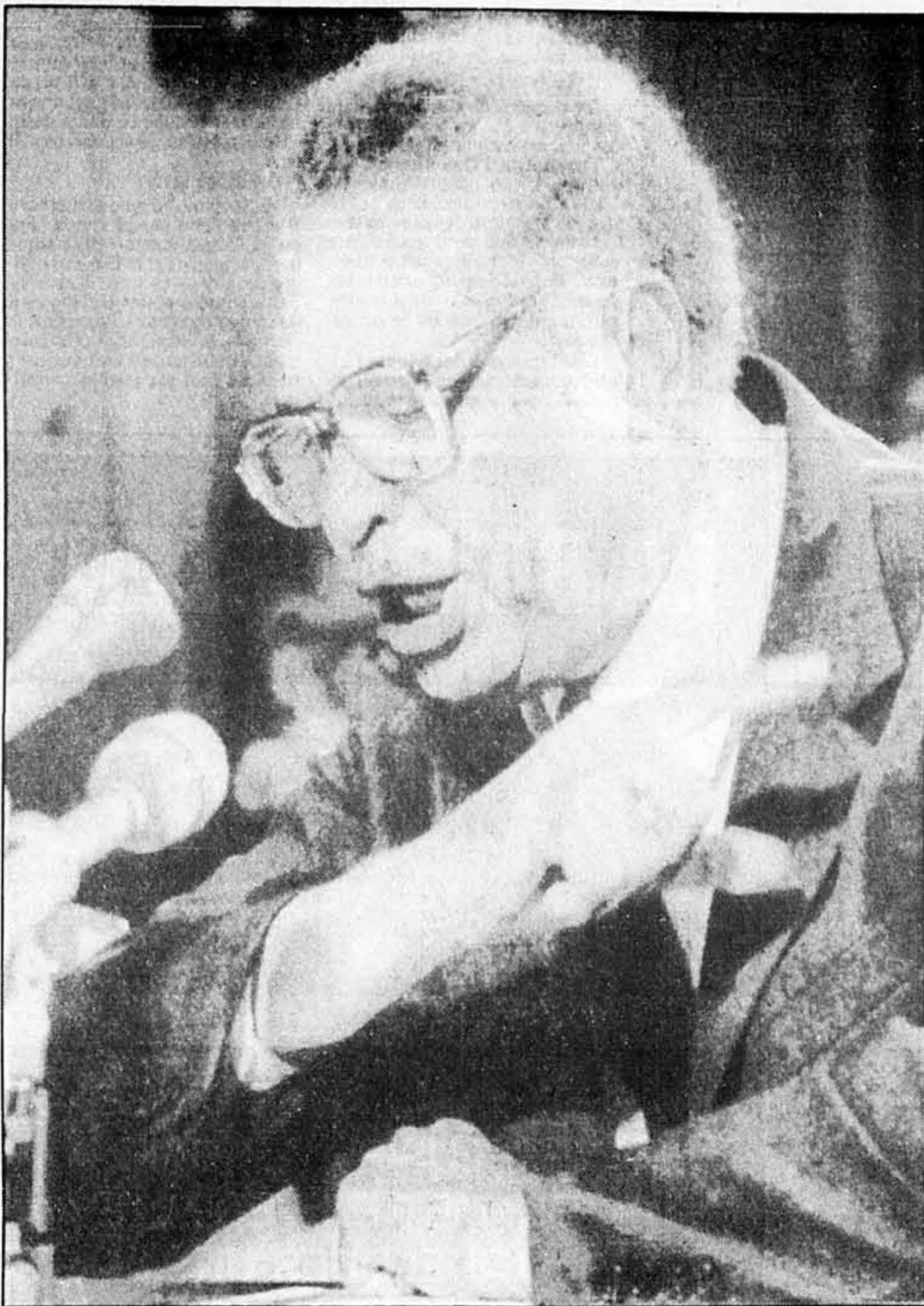
Le révérend Leon Sullivan prêche depuis plusieurs années le désinvestissement des entreprises américaines en Afrique du Sud, mais plusieurs compagnies ont trouvé moyen de contourner cette doctrine.

Ce sera donc les Noirs qui souffriront en premier, déclare-t-on à Pretoria où dans les couloirs du parlement. La question du désinvestissement fait l'unanimité — ce qui est rarissime — chez tout