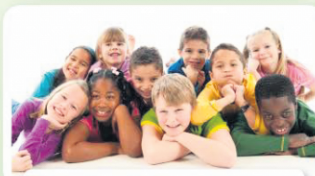
Environnement culturel enrichi