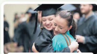
Réussite et bien-être