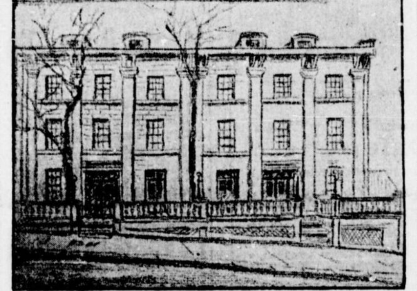
LE CLUB JACQUES-CARTIER RUE ST-VINCENT

Depuis un mois à peine que le club a ouvert ses portes, il est devenu le rendez-vous favori des amis de la cause.