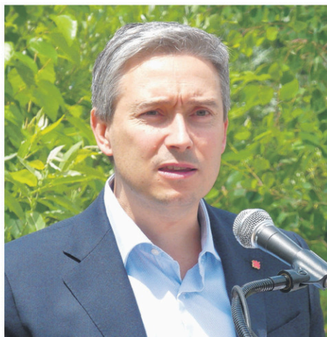
Le député et ministre François-Philippe Champagne.

«On veut créer un produit d'appel touristique. Les gens se rappellent sûrement du nénuphar (au