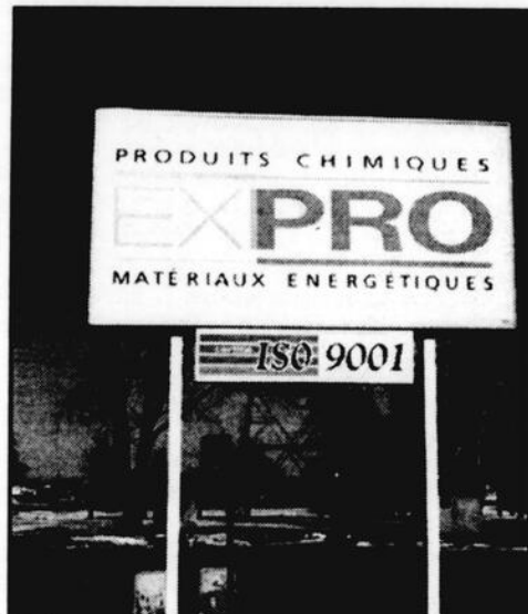
L'obtention du contrat permettra à l'usine de créer 150 nouveaux emplois au cours des prochaines années.

Produits chimiques Expro oeuvre dans les marchés commerciaux de propulsif et de matériaux énergétiques utilisés dans les sacs gonflables.