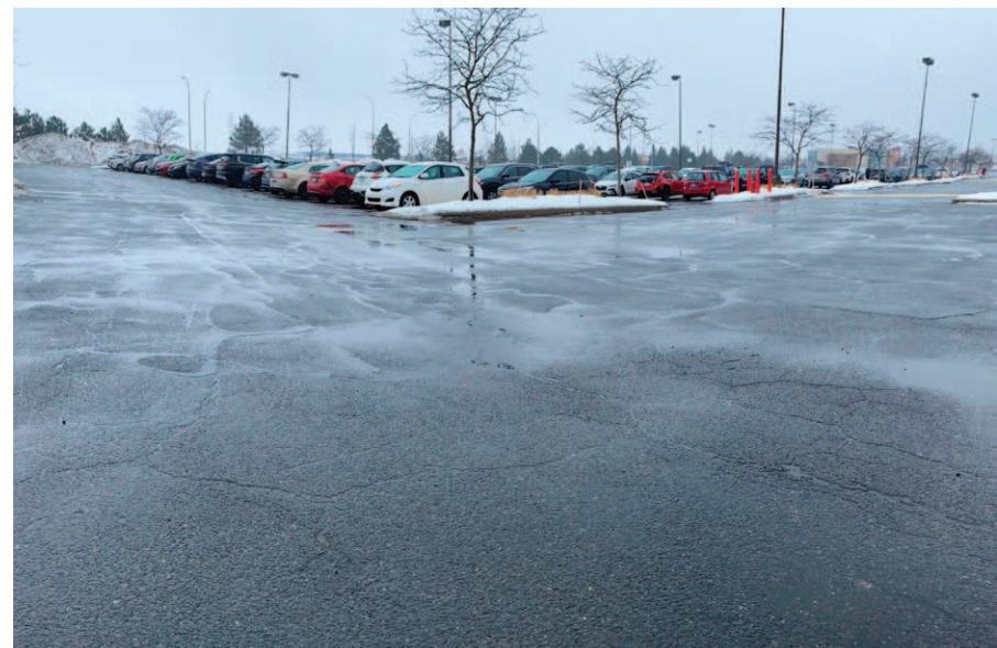
La poursuite a été déposée à la Cour supérieure du district de Longueuil.

Les revenus qui en découleront serviront à financer des mesures environnementales telles que le traitement des eaux, la mise à niveau de l'usine d'épuration des eaux, l'acquisition d'espaces verts, le maintien des milieux humides, etc.