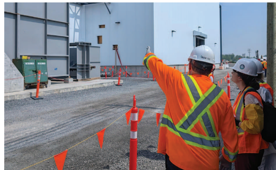
Recyclage Carbonne Varennes veut devenir le premier producteur de méthanol vert au Québec.

De son côté, Hitachi Énergie a annoncé un investissement de 140 M$ pour l'agrandissement de son usine de transformateurs de puissance à Varennes, créant 70 emplois supplémentaires d'ici 2027. Aussi, Greenfield Global a reçu une subvention de 50 M$ dans le cadre de son projet d'agrandissement de sa distillerie et de réduction de ses émissions de gaz à effet de serre de 70%, ce qui équivaldrait à retirer 17 058 véhicules à essence des routes.