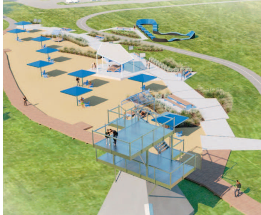
Le parc de la Commune serait réaménagé avec une plage urbaine en son coeur.

En ce qui concerne le parc de la Commune, la Ville a tenu un grand sondage auprès de sa population en 2022 afin de définir l'avenir de cette fenêtre sur le fleuve sur un horizon de 10 ans. Parmi les projets proposés, on retrouve une plage urbaine, un