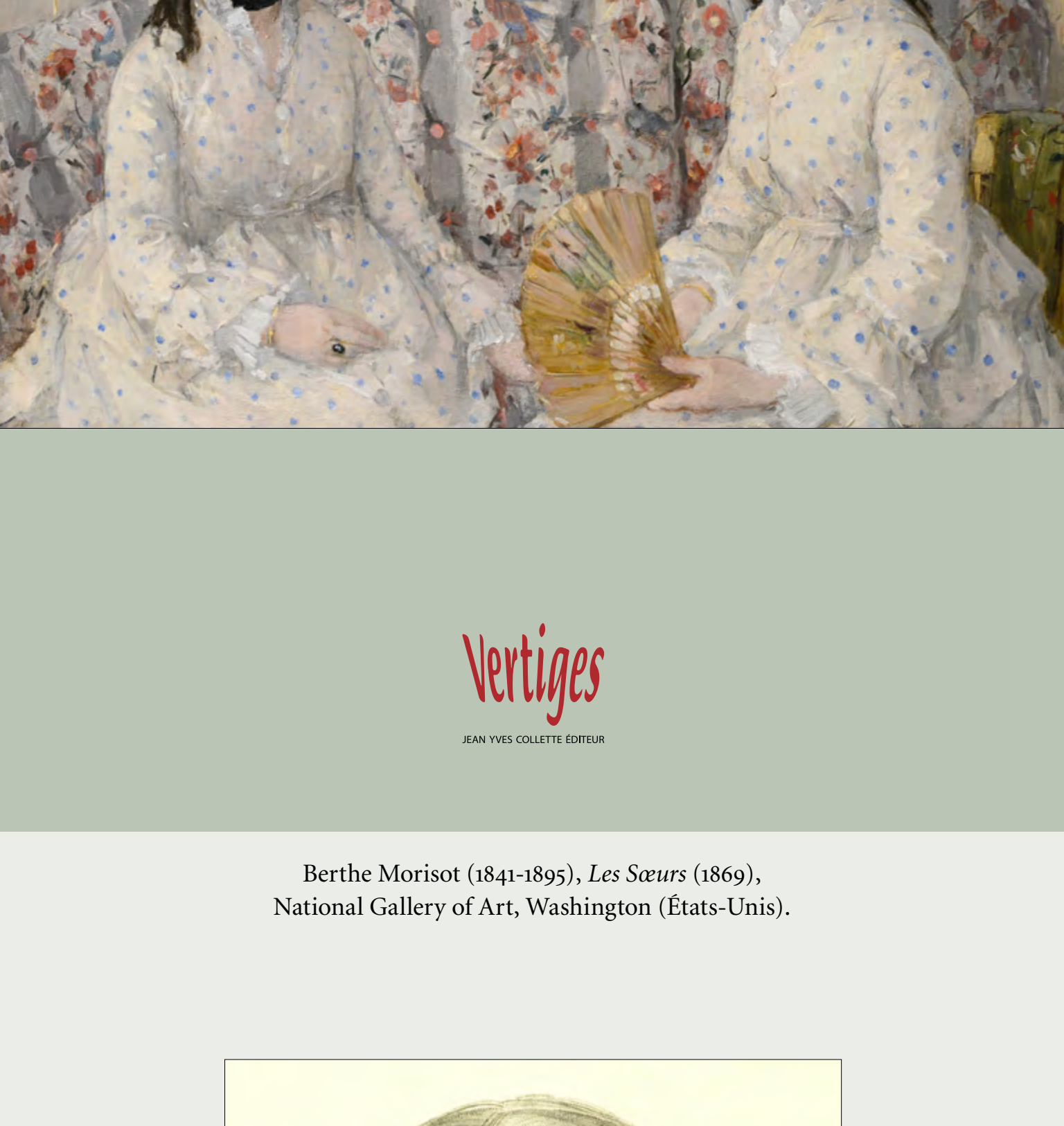
Berthe Morisot (1841-1895), Les Sœurs (1869), National Gallery of Art, Washington (États-Unis).