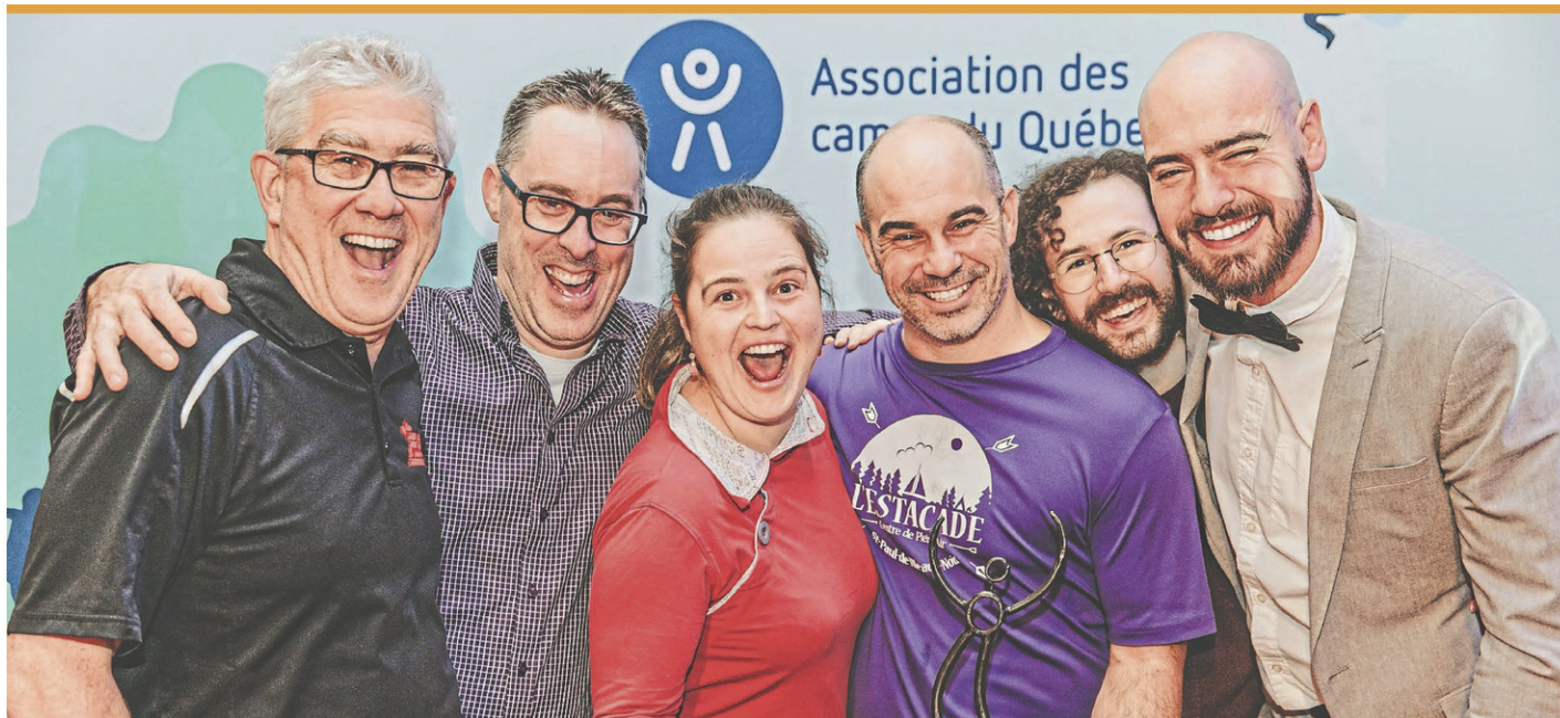
L'Estacade a remporté le Prix Excellence Développement et innovation 2023 dans la catégorie catégorie camp de vacances ou camp familial certifié, remis par l'ACQ.