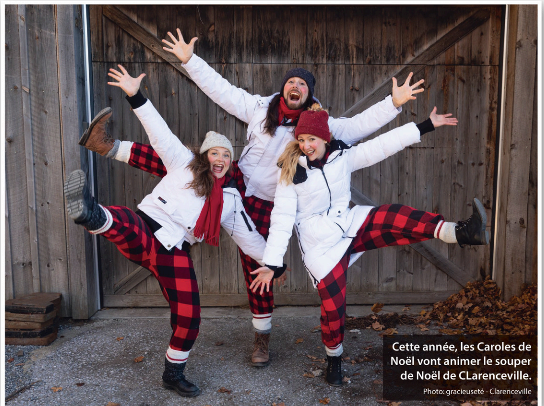
Cette année, les Caroles de Noël vont animer le souper de Noël de Clarenceville.

Les personnes qui souhaitent réserver une place peuvent le faire par courriel à loisirs@clarenceville.qc.ca ou par téléphone au 450 294-2464 poste 1041. Le repas est gratuit pour les résidents de Clarenceville. Pour les non-résidents, le coût est de 20 $ par adulte. La Municipalité a également distribué des billets pour les usagers de certains organismes de Clarenceville.