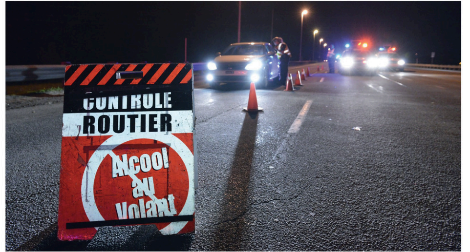
L'alcool ou la drogue demeure l'une des principales causes de décès dans les collisions routières au Québec, rappelle la SQ.

«De plus, la pratique consistant à estimer son propre taux d'alcoolémie avant de prendre le volant présente des risques importants et est conséquemment à proscrire, conclut la SQ. L'effet d'une seule consommation ne doit en aucun cas être sous-estimé. Lorsqu'on consomme, alcool ou drogue, on ne conduit pas.»