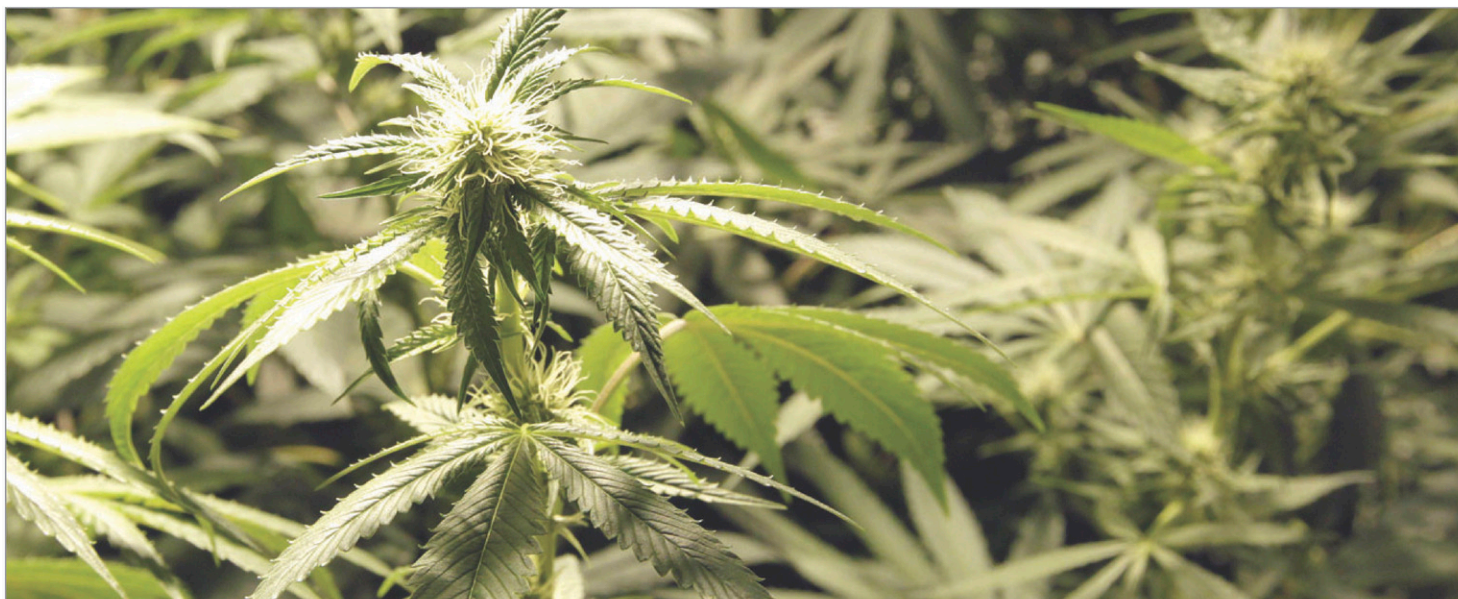
La culture de marijuana médicinale fera partie du paysage corporatif du Restigouche.

« Après avoir collaboré étroitement avec des représentants des trois ordres de gouvernement, de même qu'avec des partenaires du monde de l'éducation, de l'industrie et de la communauté, nous avons pleinement confiance que le comté de Restigouche deviendra un chef de file à l'échelle continentale dans ce marché en