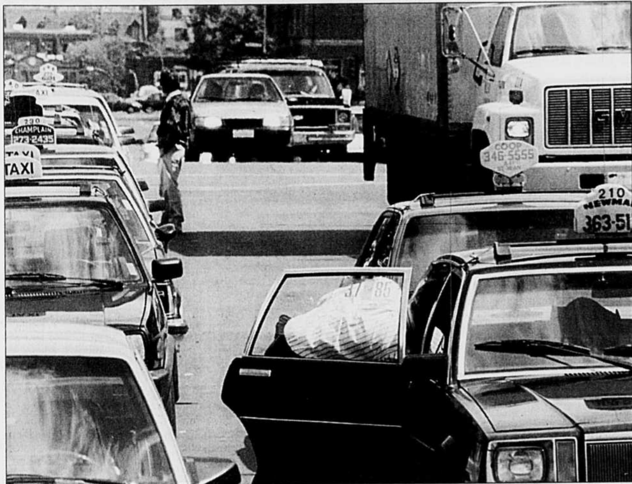
Les chauffeurs de taxi ont gagné leur bataille. La Ville de Montréal a décidé de retirer son règlement qui abolissait le privilège de stationner en zone interdite pendant quelques minutes afin d'effectuer la livraison de petits colis.