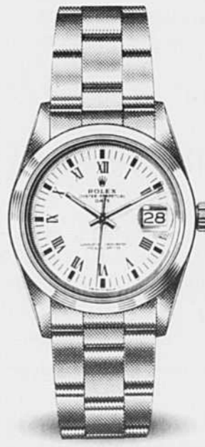
OYSTER PERPETUAL DATE

630-A Cathcart Montréal Centre-Ville 866-3876