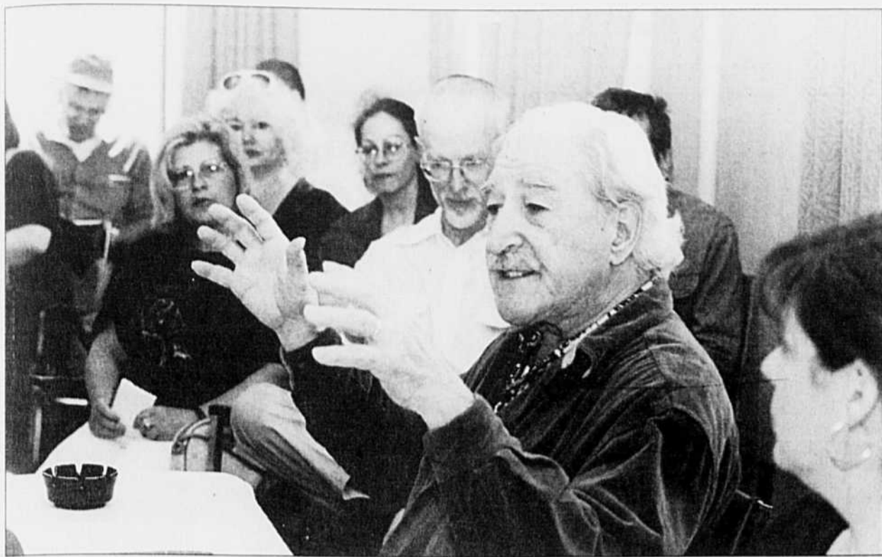
Michel Chartrand, militant du Rassemblement pour une alternative politique.