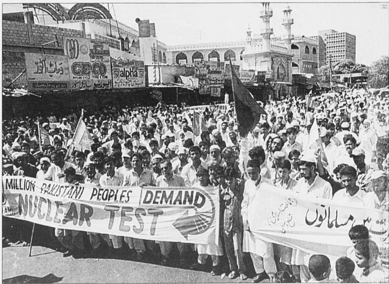
Manifestation en faveur des tests nucléaires pakistanais à Islamabad, la capitale du Pakistan.

Un tel triangle de collaboration porte les germes d'une véritable alliance militaire dont les conséquences pourraient s'avérer catastrophiques pour le système international. La politique de double norme des grandes puissances, qui régule les rapports interétatiques, est dorénavant désuète à la suite des développements militaires des derniers mois. La mise sur pied d'un cadre international chaotique des structures régionales pourrait assurer la stabilité du système. Ce double mécanisme de régulation permettrait de prendre en compte les particularismes nationaux, offrant ainsi une plus grande possibilité d'ajustement et de contrôle sur les nouveaux développements de la scène internationale.