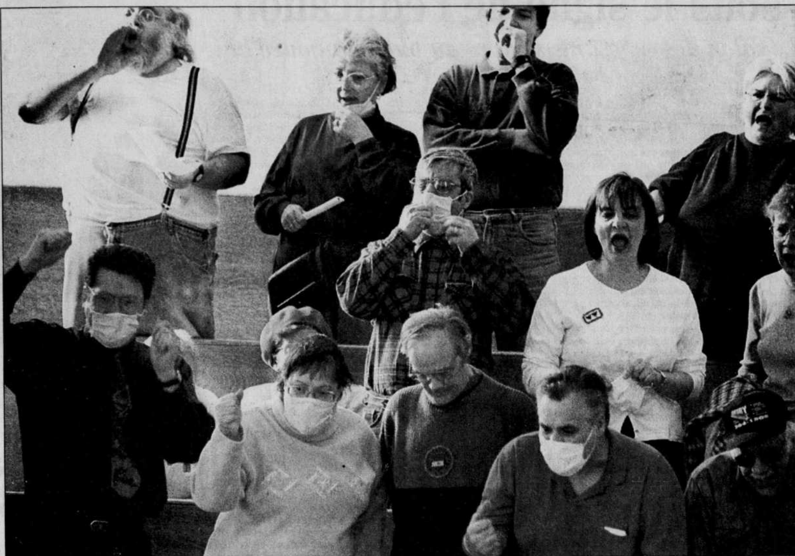
Les citoyens en colère, masque sur le visage, n'ont pu convaincre les membres de la Commission du développement urbain de rejeter le projet de Matrec. Le Comité exécutif et le Conseil municipal devront maintenant se prononcer.

Selon des données fournies par des opposants du projet de loi 11, entre 50 et 60 % des personnes ayant été opérées à Calgary pour des cataractes dans des cliniques privées avaient déboursé entre 250 et 750 $ pour une opération habituellement gratuite, parce qu'ils s'étaient sentis obligés d'acheter des lentilles de qualité supérieure.