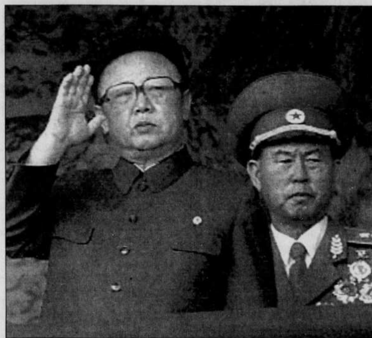
Le leader de la Corée du Nord, Kim Jong Il, en septembre 1998 lors de la cérémonie marquant le 50 e anniversaire du pays.

Cette perspective de dialogue au plus haut niveau est l'aboutissement de la politique d'ouverture vers le nord, la «diplomatie ensoleillée», lancée voilà deux ans par le nouveau président Sud-Coréen. Cette politique de «main tendue» vers le nord repose sur