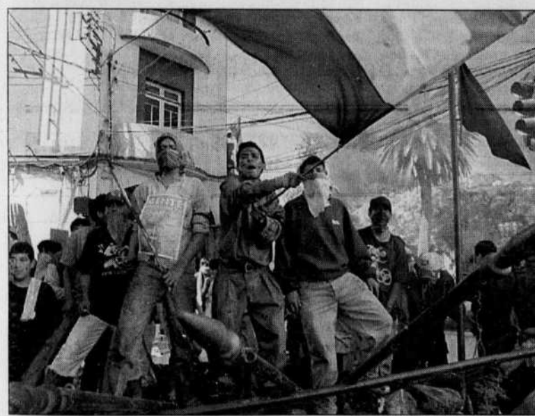
Des manifestants brandissaient le drapeau bolivien lors d'une grève hier pour protester contre l'augmentation du coût de l'eau.