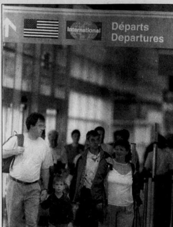
En 1999, l'aéroport de Dorval a connu une croissance de ses activités de 5,1 %, soit la plus forte croissance de tous les aéroports canadiens de taille majeure.

Globalement, en 1999, l'aéroport de Dorval a connu une croissance de ses activités de 5,1 %, soit la plus forte croissance de tous les aéroports canadiens de taille majeure. Et cette année, avec l'addition de nombreux vols transfrontaliers et domestiques directs à partir de Dorval, ADM pré-