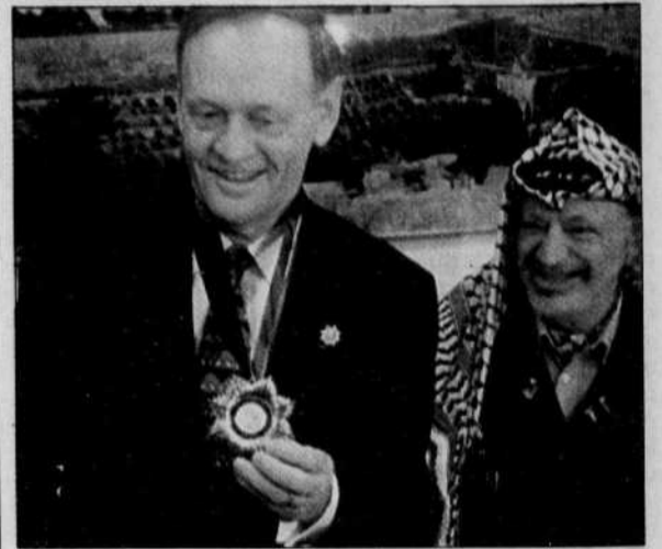
Jean Chrétien a rencontré hier à Gaza le leader palestinien Yasser Arafat.