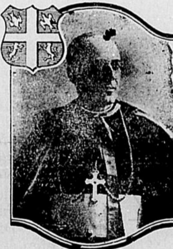
MGR FRANCOIS-XAVIER CLOUTIER EVÊQUE DE TROIS-RIVIÈRES