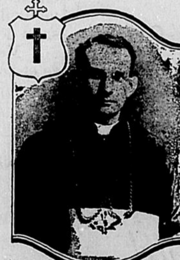
MGR JOSEPH-ROMUALD-LEONARD EVÊQUE DE SAINT-GERMAIN DE RIMOUSKI