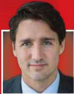
TRÈS HON. JUSTIN TRUDEAU DÉPUTÉ / MP Papineau Justin.Trudeau.c1c@parl.gc.ca (514) 277-6020