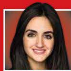
EMMANUELLA LAMBROPOULOS DÉPUTÉE / MP Saint-Laurent Emmanuella.Lambropoulos@parl.gc.ca (514) 335-6655