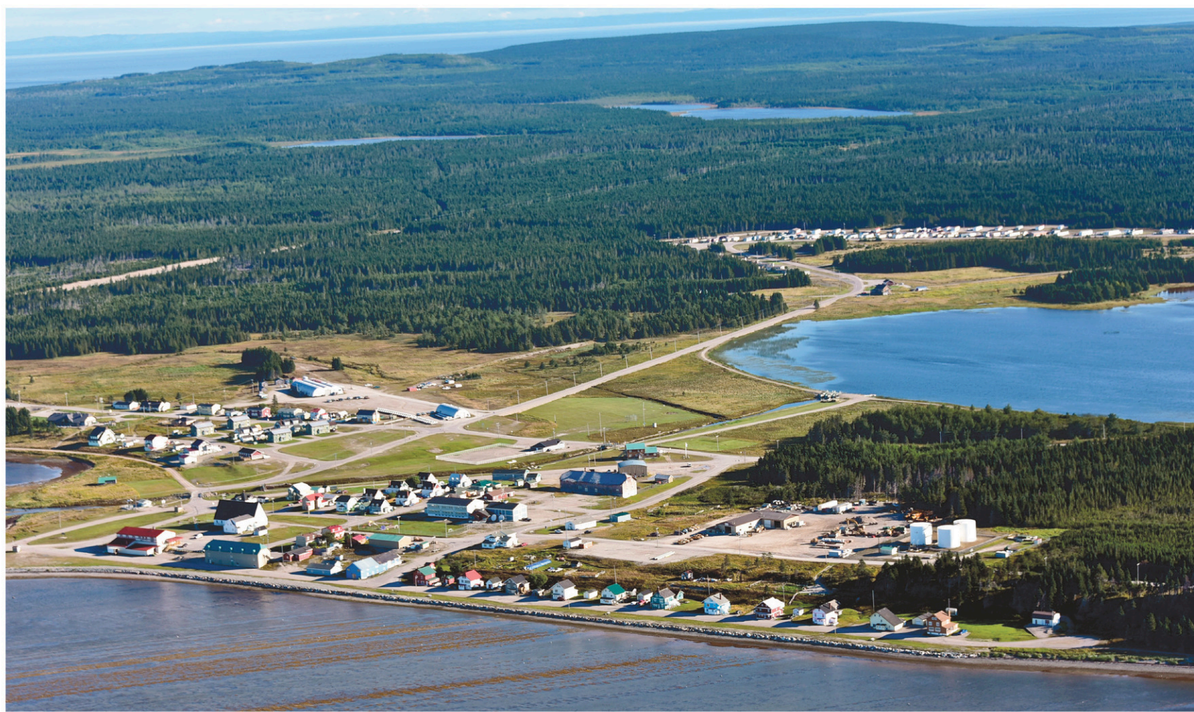
Le village de Port-Menier sur l'île d'Anticosti