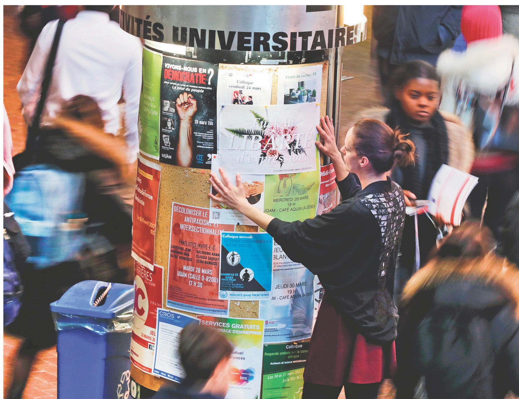
JACQUES NADEAU LE DEVOIR

Il n'y a pas de bonne censure. Même lorsque ceux qui la cautionnent à demi-mot le font sincèrement pour le plus grand bien de tous. Faisons davantage confiance aux citoyens pour se forger une opinion. Le bon peuple a souvent plus de bon sens que les soi-disant élites lui en accordent crédit.