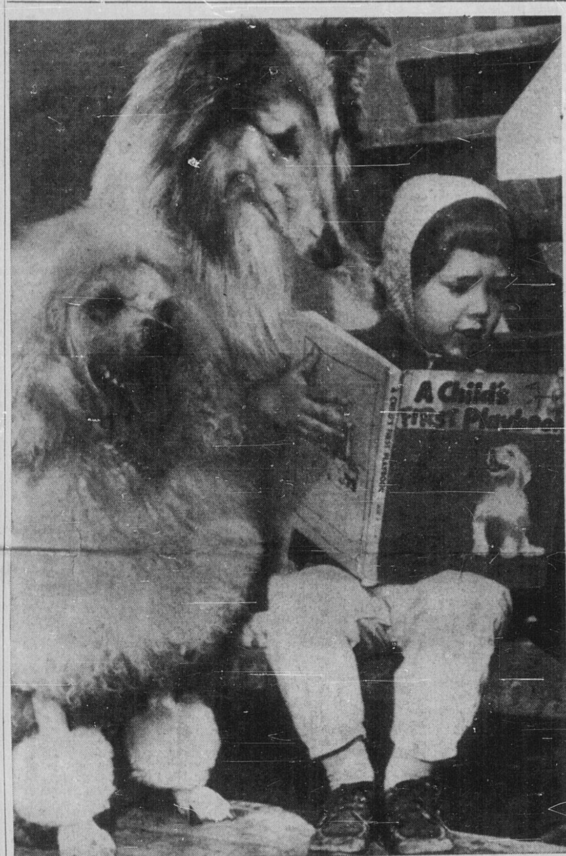
LE CHIEN EST L'AMI DE L'HOMME... C'est le dicton populaire... mais il est aussi l'ami de l'enfant... surtout quand cet enfant est une charmante fillette intéressée à son gros livre d'images qui illustrent... ses amis de la race canine. Ce collie et ce caniche s'assurent que la bambine ne manque pas une image.