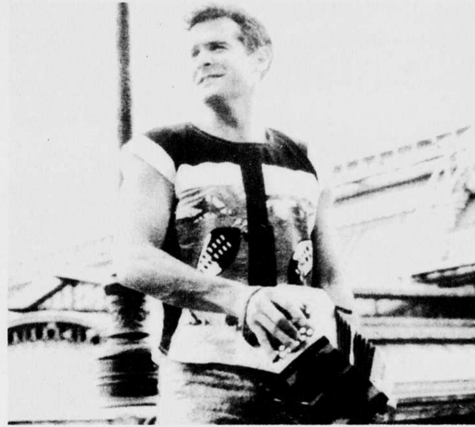
Johnny Clegg et son groupe multiethnique Savuka lanceront leur tournée nord-américaine à Montréal, le 5 juillet au festival de jazz.

Une salle s'ajoute au calendrier du neuvième festival, le Club Soda. Certains des concerts en plein air y seront repris à 23h30, l'entrée demeurant gratuite.