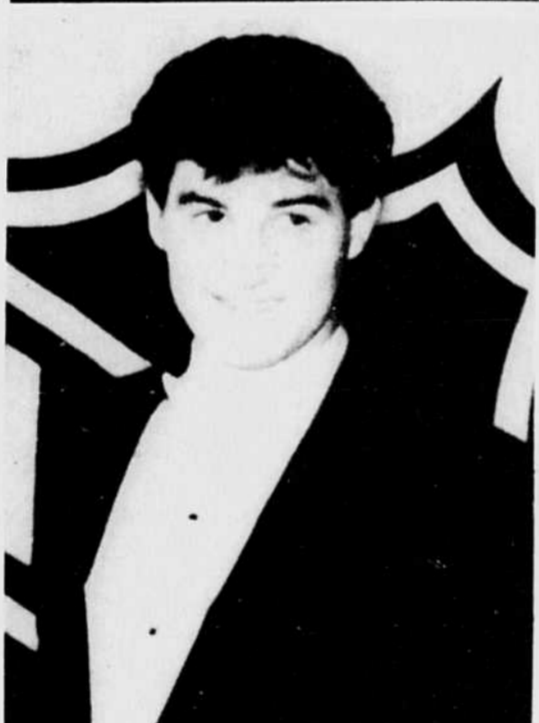
D'autres honneurs pour Mario Lemieux...