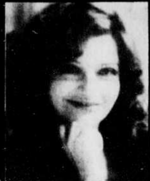
Idil Biret Vendredi 15 juillet