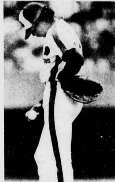
Pascual Perez est déçu. Sa balle glissante n'est pas à point...