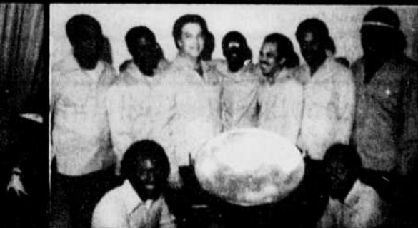
Trinidad Steel Band 7 août