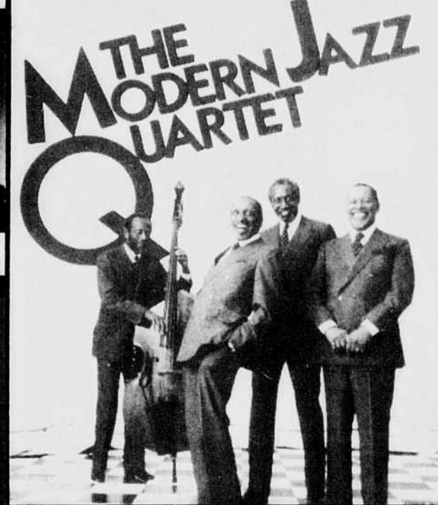
Grand Concert-Jazz. Vendredi 5 août