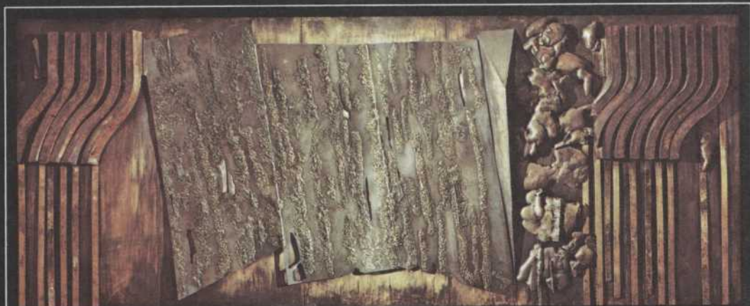
Murale de bronze de Peter Gnass