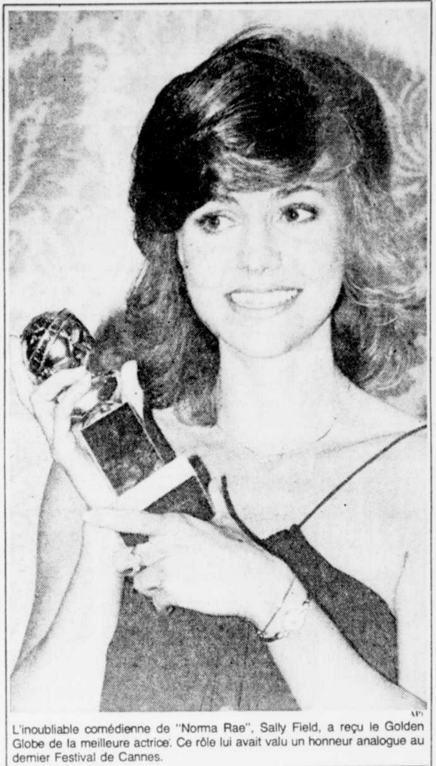
L'inoubliable comédienne de "Norma Rae", Sally Field, a reçu le Golden Globe de la meilleure actrice. Ce rôle lui avait valu un honneur analogue au dernier Festival de Cannes.