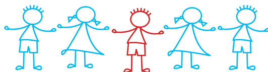
Table de concertation pour l'intégration des enfants handicapés dans les services de garde de l'Estrie.

Cliquez ici pour consulter la version électronique du bulletin.