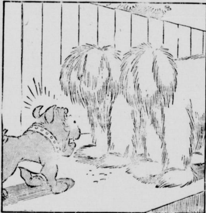
"Lequel de vous deux a-t-il grogné?"