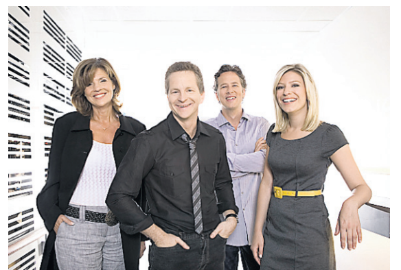
C'est juste de la TV