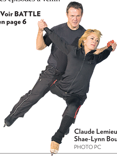
Claude Lemieux et Shae-Lynn Bourne