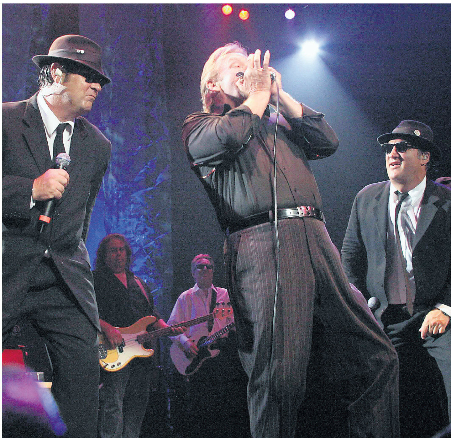
Donnie Walsh, du Downchild Blues Band, entouré des Blues Brothers: Elwood (Dan Aykroyd), à gauche, et Zee (James Belushi), à droite.