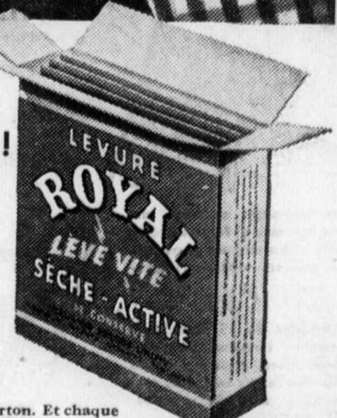
4 enveloppes dans chaque carton. Et chaque enveloppe vous donne 4 gros pains.

La Royal conserve toute sa vigueur durant des semaines dans votre garde-manger. Demandez-en aujourd'hui à votre épicer.