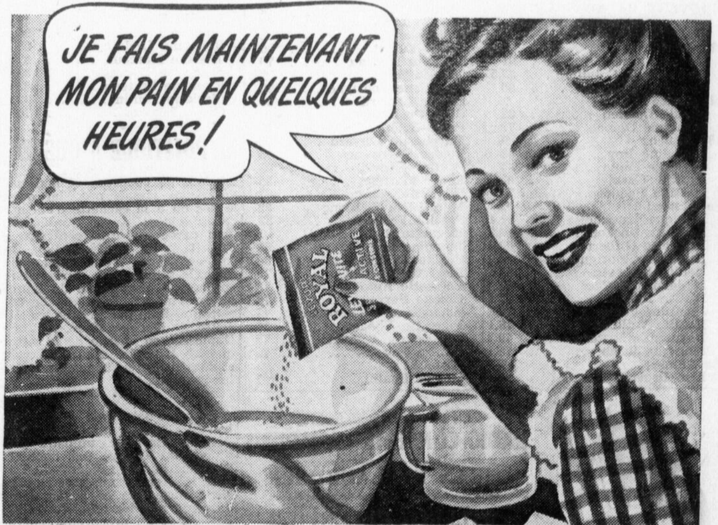
10 minutes après sa dissolution dans l'eau, la nouvelle Royal à action rapide commence à agir.

Cie Chimique FRANCO Américaine Ltée, 1566 rue St-Denis, Montréal 18.