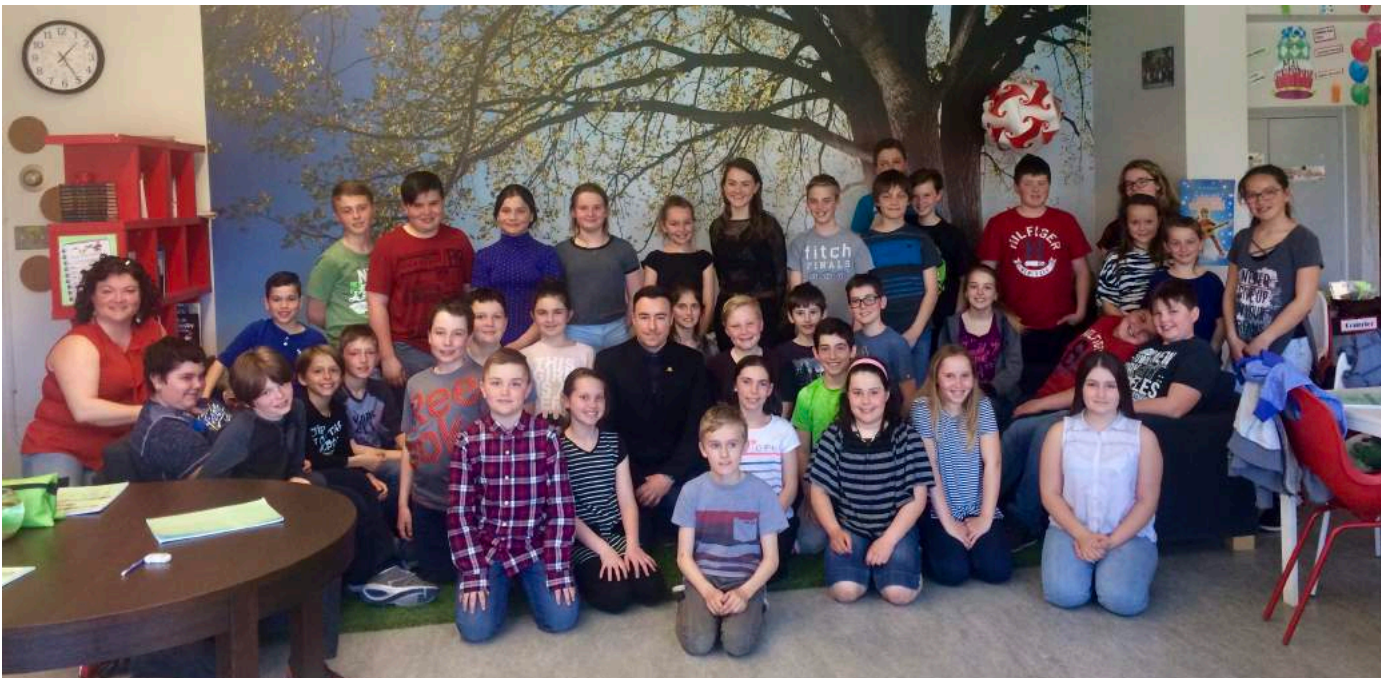
7 mai 2018 : Rencontre du maire Bolduc avec les élèves de 5 ème et 6 ème année, discussion sur le rôle des élus, de l'importance de l'engagement citoyen et survol de jeux vidéo (sur l'écran) dans lesquels le joueur doit gérer une ville.