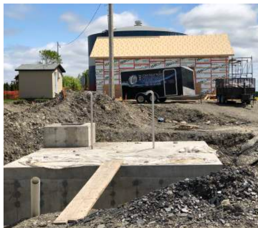
Construction: centrale d'eau potable