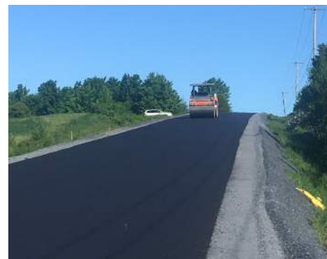
Asphaltage Rang 3 Nord