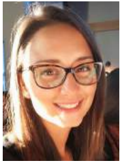
Par Karine Bolduc Responsable des communications et recrutement

Encore une autre belle année qui se termine au Cercle des Fermières de Saint-Victor. Nous pouvons dire que notre programmation était très diversifiée et a suscité beaucoup d'intérêt au sein du groupe.