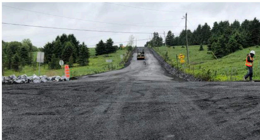
Travaux Route Gosselin (en direction du Rang 5 Nord)