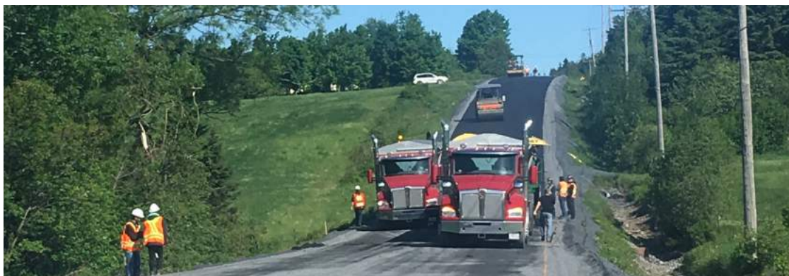
Asphaltage Rang 3 Nord