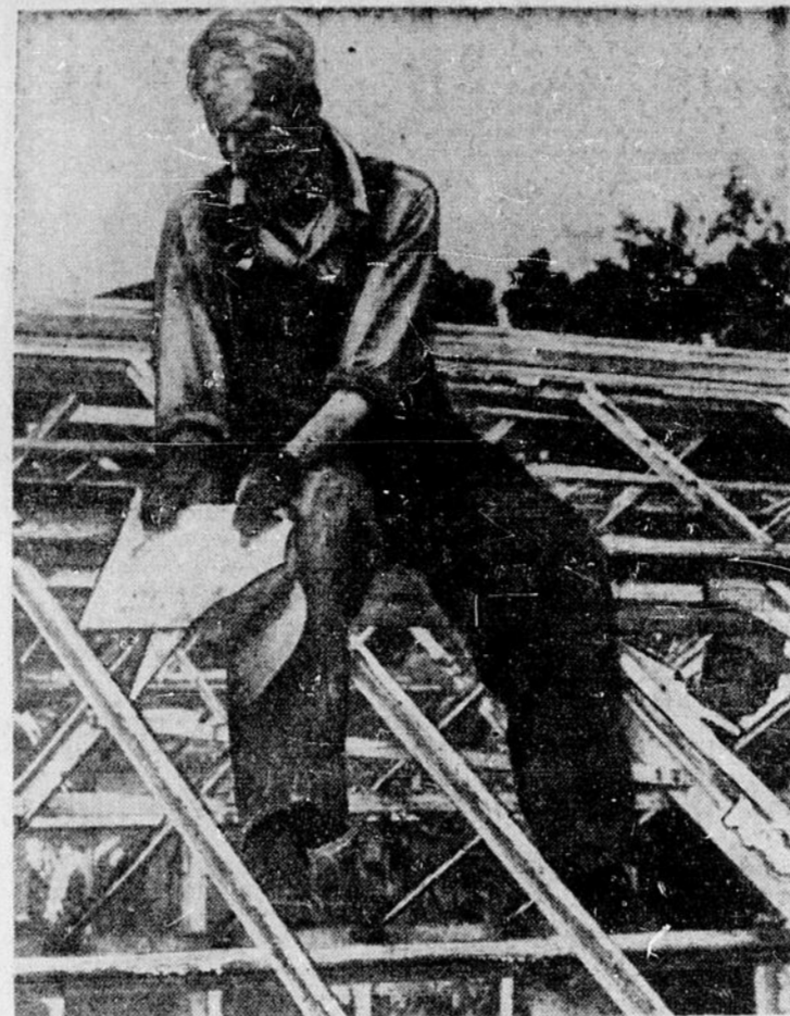
La pire tempête de grêle dans l'histoire de Kemptville, à 30 milles au sud d'Ottawa, a causé des dégâts se chiffant par près de $300,000 et a blessé trois personnes. Le bombardement de 20 minutes de grêlons mesurant jusqu'à 13 pouces de diamètre a démolé des toits, tué des chiens et des chats ainsi que de nombreux animaux de basse-cour, en plus de saccager plusieurs automobiles et d'innombrables fenêtres et vitres de toutes sortes comme celles de la serre au collège agricole de Kemptville, que l'on voit ci-haut.

Les Lacordaire de Maniwaki n'ont rien épargné pour faire du 6 juillet un vrai triomphe à la cause de l'abstinence totale. Ils ont retenu les services d'orateurs puissants qui instruiront la foule attendue pour cette occasion. M. Victorien Maher, chanteur populaire et comédien très recherché, qui a soulevé l'enthousiasme de nombreux auditeurs, dans tous les coins de la province de Québec, saura faire de cette soirée du 6