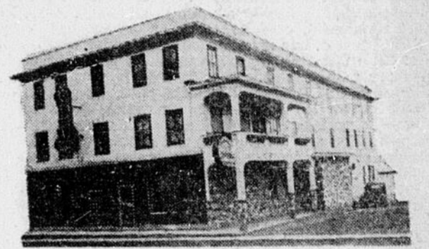
HOTEL CENTRAL MANIWAKI, Qué. — Tél: 378