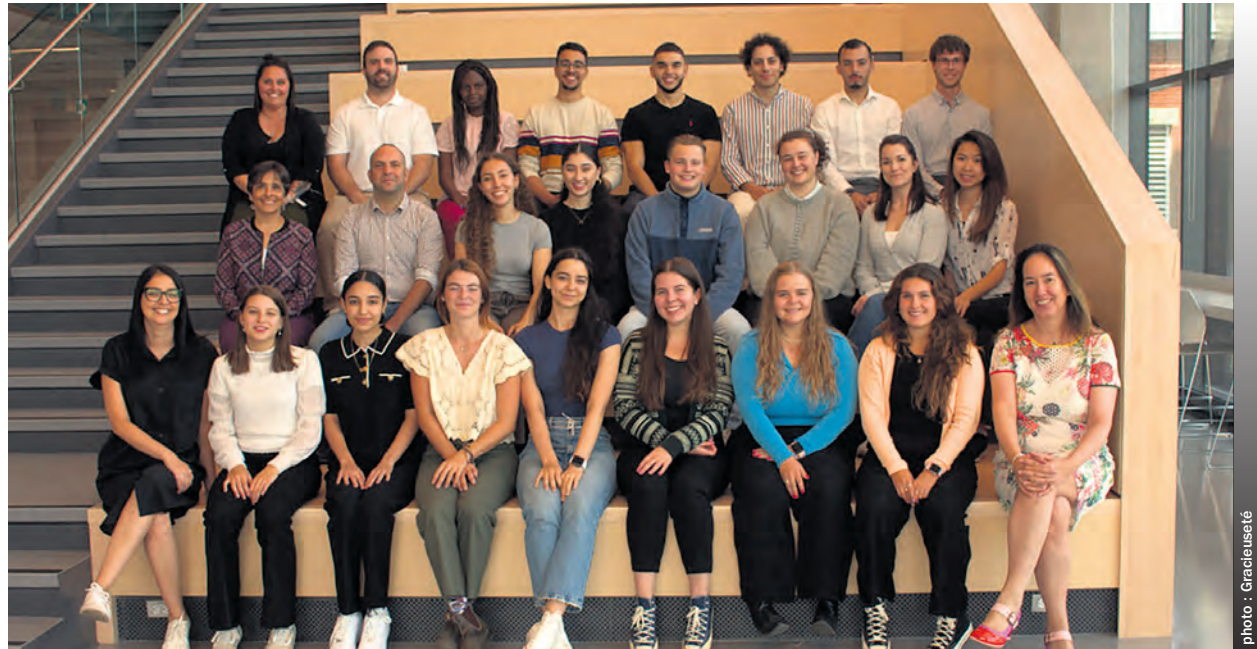
La deuxième cohorte d'étudiants de médecine.

«Ce sont encore tous des Rimouskois d'adoption. L'année dernière on avait fait le pari de les intégrer correctement et de leur montrer que la région pouvait vraiment être un beau milieu et