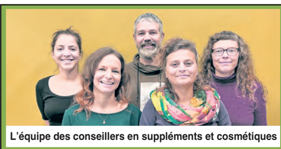
L'équipe des conseillers en suppléments et cosmétiques

La famille a l'intention de repartir à l'aventure dès que possible. Malgré tous les kilomètres parcourus en Europe, les quatre aventuriers utilisent régulièrement leurs vélos pour se déplacer depuis leur retour à Rimouski. L'expédition a été documentée sur le site https://cyclobonbon.ca/ .