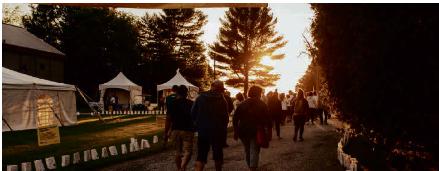
Le Relais pour la vie de la MRC d'Acton a fait un beau retour samedi, avec comme site - pour la première fois - le Théâtre de la Dame de Cœur.

En tout, 103 participants - répartis en dix équipes - ont marché sur le sentier entre 18 h et minuit - le trajet de nuit a été mis de côté cette année - afin d'honorer les gens qui ont livré ou qui livrent une bataille contre le cancer. « C'est vraiment une très belle participation et tout le monde était vrai-