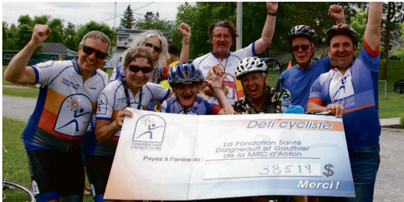
Le Défi cycliste Desjardins de la Fondation Santé Daigneault-Gauthier a permis d'amasser 38 918 $, le second meilleur résultat de l'histoire du rassemblement.

Les cyclistes, qui pouvaient s'inscrire dans un des trois circuits proposés, ont bénéficié d'un encadrement impeccable, avec des signaleurs aux intersections afin d'assurer la sécurité. Des bénévoles sillonnaient les trajets à moto et en voiture en plus d'une signalisation très détaillée.