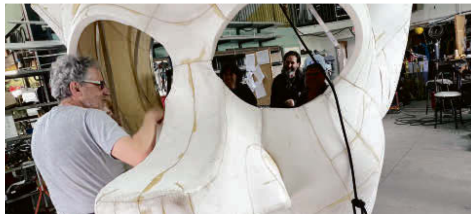
Le Théâtre de la Dame de Cœur a utilisé de nouvelles méthodes de fabrication pour ses marionnettes géantes pour sa nouvelle création, Victor et le cadeau des songes , à l'affiche dès le 1 er juillet.

Les représentations auront lieu à partir de 20 h 30 en juillet et dès 20 h en août, du mercredi au dimanche. Information et réservations : 450 549-5828 ou www.damedecoeur.com .