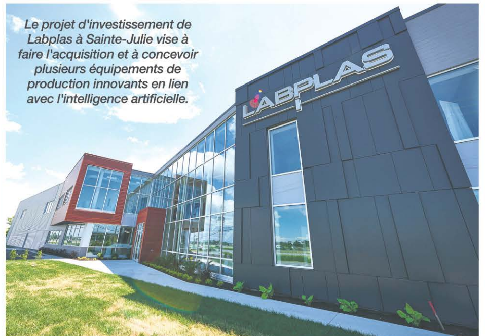
Le projet d'investissement de Labplas à Sainte-Julie vise à faire l'acquisition et à concevoir plusieurs équipements de production innovants en lien avec l'intelligence artificielle.

Notons en terminant que les projets qui seront réalisés par ces deux entreprises de la Montérégie représentent des investissements totalisant 4,85 M$.