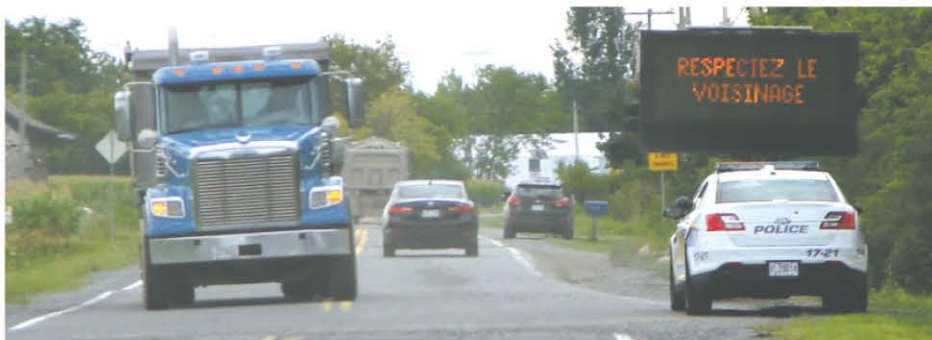
La Cour d'appel a décidé que la circulation des camions lourds sera interdite sur le chemin de la Butte-aux-Renards le soir, la nuit et les fins de semaine, et ce, au moins jusqu'à la fin du chantier de l'échangeur Turcot en 2020.