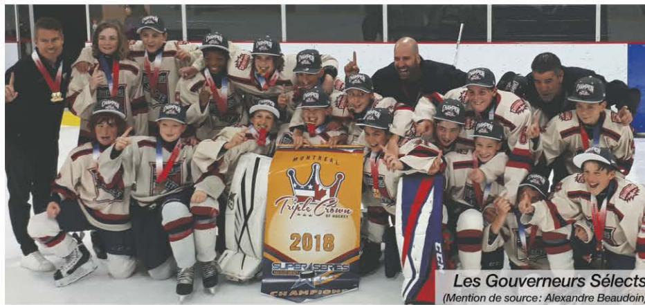
Les Gouverneurs Sélects

« Dans un marathon de neuf parties en cinq jours, les jeunes joueurs pee-wee se sont frottés à des équipes du Minnesota, de l'Ontario, de la Saskatchewan, des provinces de l'Atlantique, de la Californie, de la Floride, de l'Est de l'Amérique du Nord, du Manitoba, de la