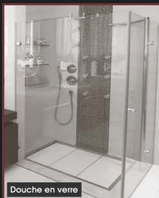
Douche en verre