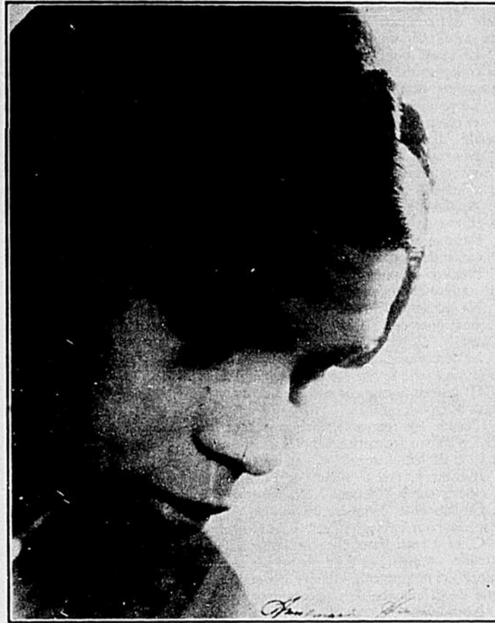
MARION ANDERSON LA TRÈS CÉLÈBRE