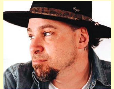
Le samedi 9 juillet en soirée, ce sera place au spectacle de musique pop, folk et country de David Jalbert à 20 h 30, suivi des feux d'artifice vers 22 h.

Calixa-Lavallée a été constituée en 1878, soit à peu près en même temps que l'Exposition agricole qui célèbre sa 142 e édition, ce qui est pour le moins impressionnant. Le vendredi 8 juillet prochain, la Société d'agriculture du comté de Verchères et la Municipalité vous convient d'ailleurs à venir célébrer l'ouverture de cette grande activité familiale avec le souper méchoui, les feux d'artifice et la soirée DJ.