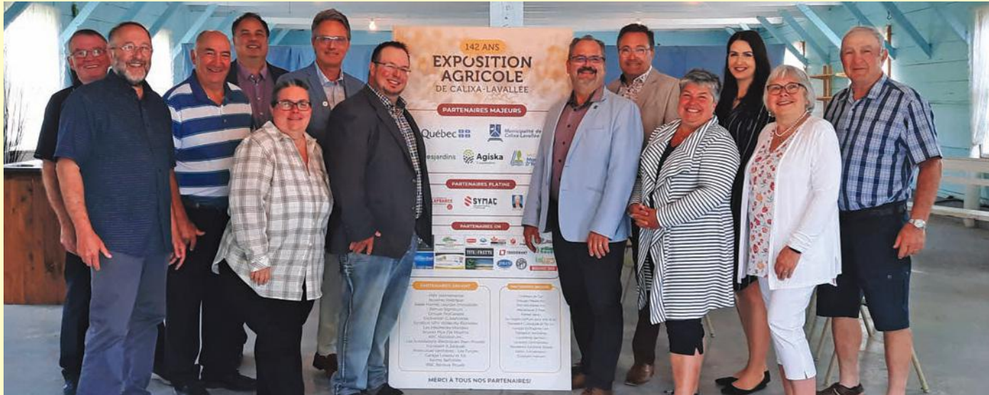
Le 2 juin, la Société d'agriculture du comté de Verchères accueillait ses partenaires et commanditaires pour dévoiler la programmation officielle complète de la 142 e édition de l'Exposition agricole de Calixa-Lavallée.