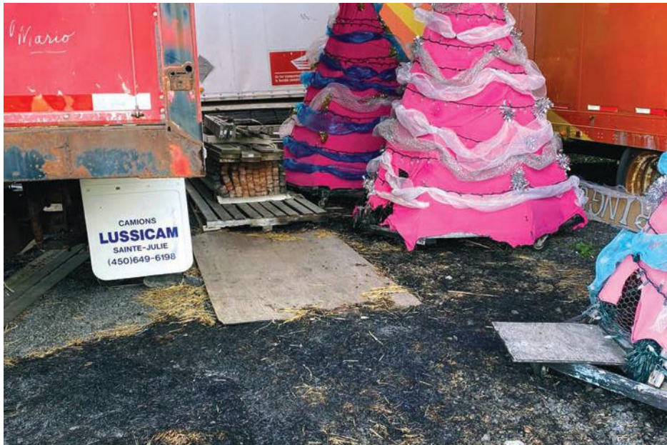
Heureusement, le feu des vandales s'est arrêté près des sapins de Noël en toile, car il y avait tout à côté des piles de bois qui se trouvaient près des remorques et de l'atelier principal de l'organisme...

Au moment d'écrire ces lignes, le président devait parler avec la direction des Camions Lussier qui est, elle aussi, excédée par ces actes extrêmement dangereux et gratuits. Rappelons qu'à la suite des premiers méfaits survenus le 16 mai dernier, le site devait être surveillé 24 heures sur 24, mais il faut toutefois préciser que le terrain est très vaste et qu'il fait près d'un mille de longueur.