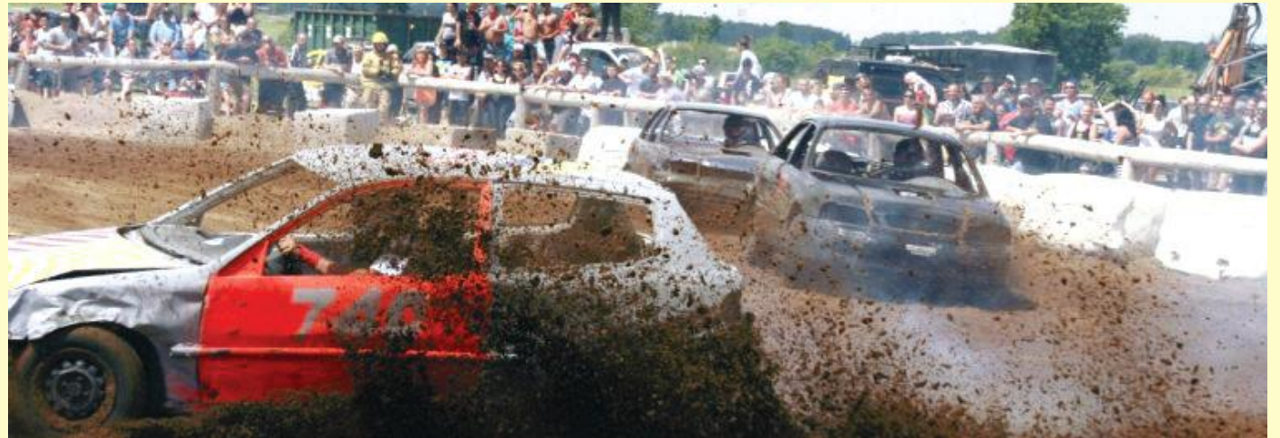
Comme c'est la tradition le dimanche, la journée débutera par la grande messe sous le chapiteau, suivie du brunch familial et finalement, par le toujours populaire derby de démolition.

Par la suite, vous pourrez découvrir les beautés du village environnant!