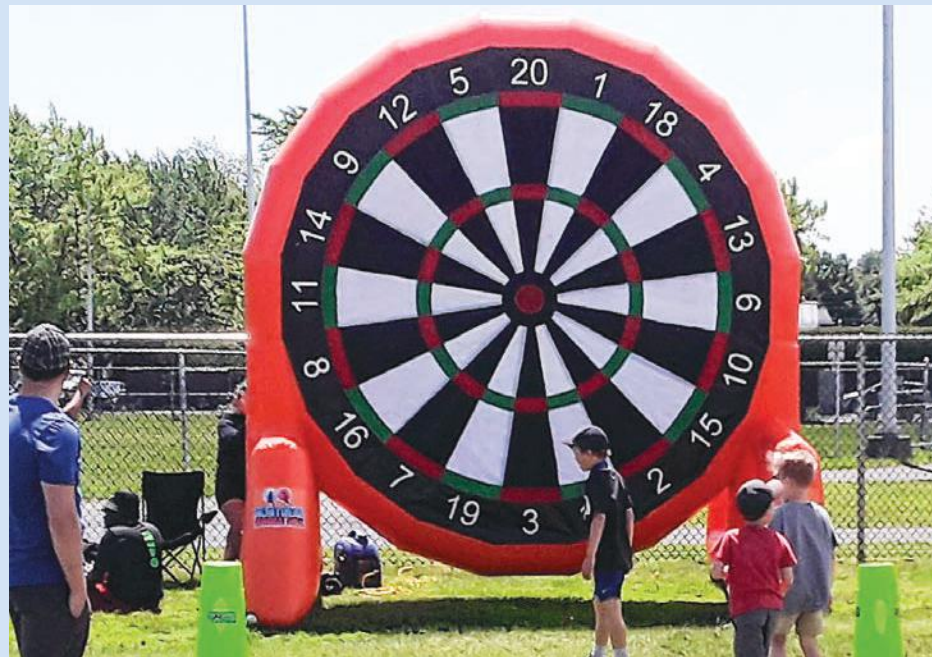
Une cible géante a permis aux festivaliers de mesurer leur précision.

Plus d'une quinzaine d'organismes du milieu du sport et du loisir étaient sur place pour permettre aux participants de faire l'essai de différentes disciplines, de