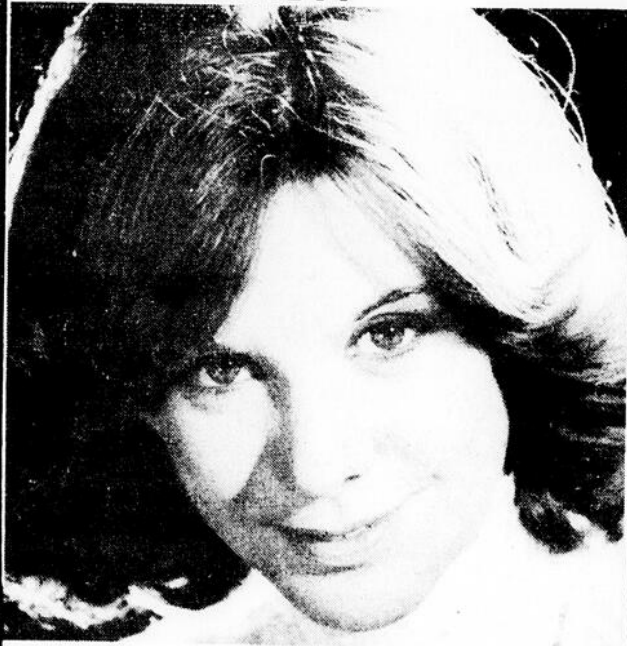
(article en page 12)