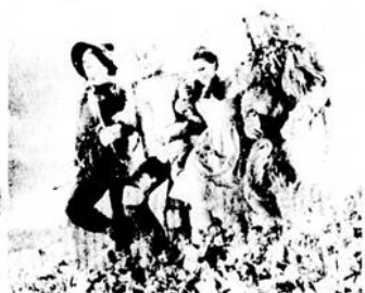
Le Magicien d'Oz

Sorti à New York en août 1939, ce film a fait courir les foules du monde entier. Au merveilleux de l'histoire, Victor Fleming ajoute le charme et l'entraînement de la chanson et de la danse. De cette féerie, une nouvelle étoile se fixait au firmament hollywoodien: Judy Garland, qui à cette époque n'avait que 15 ans.