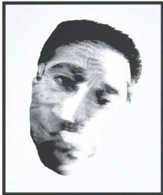
Ralph Hage, Autoportrait en tant que dislocation , 2004, 24 X 22 7/16

Recevez par courriel, peu avant sa parution, le sommaire détaillé du numéro en vous inscrivant sur la liste d'envoi. Pour ce faire, écrivez votre adresse au lieu indiqué sur la page d'accueil de notre site Internet : www.revuerelements.qc.ca