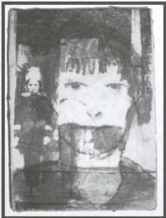
Joanne Bouchard, Tracé de mémoire , technique mixte, 18 x 13 cm, 2005