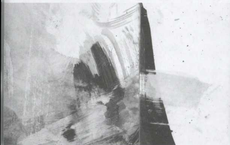
Voyage d'essoufflé, acrylique et encre sur carton, 21,8 cm X 5,8 cm, 2005

Il s'extirpe de son sac de couchage. Même le ciel s'achemine, comme c'est beau la neige, comme c'est réconciliant. En tournant le coin de la rue, il voit l'autobus arriver. Il ignore où est l'arrêt, mais il court, au cas où, le trottoir est glissant et ça le fait rire. L'autobus le dépasse, s'arrête, l'attend. Il paie son dernier voyage en petite monnaie. ●