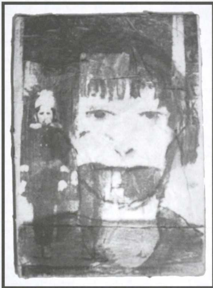
Joanne Bouchard, Tracé de mémoire , technique mixte, 18 x 13 cm, 2005

grâce à une loi qui lui a permis de produire des génériques à partir des médicaments brevetés. L'emploi y a été multiplié par 48. Cette industrie a rendu disponibles sur le marché indien des produits pharmaceutiques à très bas prix; beaucoup plus bas qu'au Pakistan, qui a conservé l'ancienne loi britannique sur les brevets. Mais, mondialisation oblige, en 2005 l'Inde a dû se plier aux règles de l'Organisation mondiale du commerce (OMC). Elle ne pourra donc plus copier des médicaments brevetés à l'avenir.