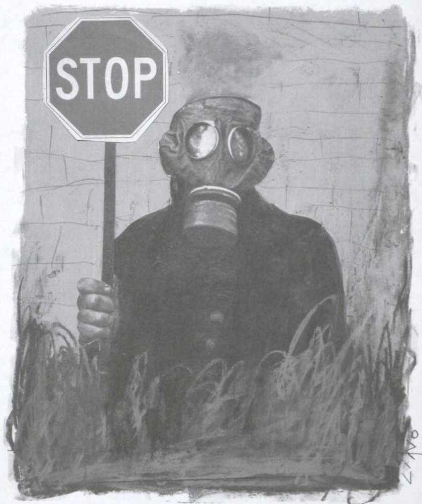
Lino, Les derniers humains , acrylique et collage sur papier, 2005

À Montréal, il y aura 189 parties à la convention dans le cadre du CdP 11 (incluant les États-Unis) et 140 parties à la rencontre des partenaires du Protocole (MdP 1), les États-Unis n'étant pas membres. La Conférence de Montréal devrait regrouper environ 7000 participants: 3000 délégués, 1000 journalistes, 3000 observateurs d'organismes gouvernementaux internationaux et d'ONG et un nombre indéter-