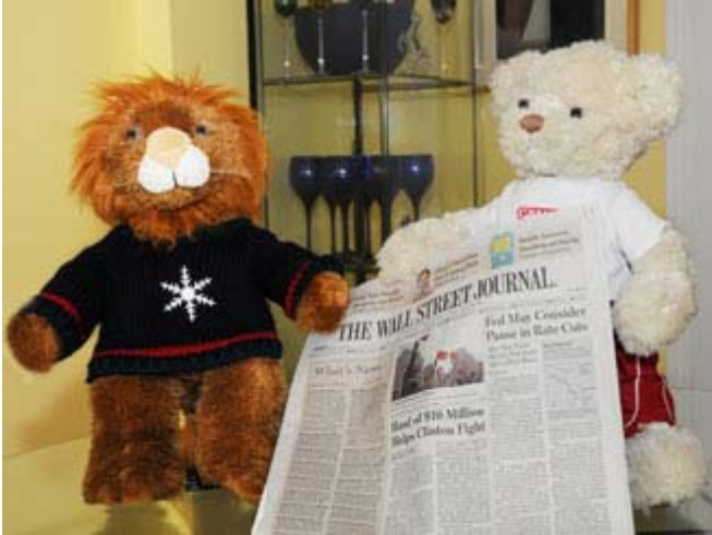
Les mascottes Monsieur X et Miss Gym

Les revenus des journaux papier sont en baisse dramatique. On attribue une partie de cette situation à la crise du crédit, en particulier dans l'immobilier. Les groupes de presse américains affichent tous des pertes importantes, comparé à l'an dernier, et malgré le succès de leur secteur Internet, cela ne suffit pas à compenser les pertes du secteur papier. Le groupe le plus en difficulté est Tribune de Chicago qui a une dette d'acquisition de 12,8 milliards$. Selon Rupert Murdoch, propriétaire de News Corp et Dow Jones , le défi est de trouver une nouvelle formule de présentation et de vente publicitaire des journaux papier qui permettra de cibler les consommateurs individuellement, comme on peut le faire avec l'Internet.