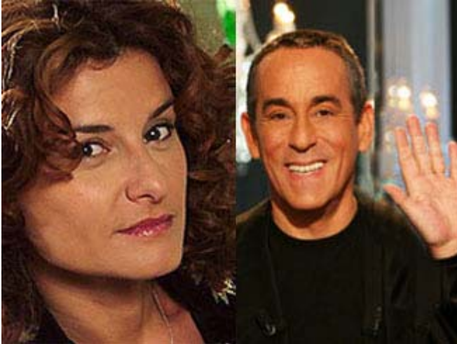
Chantal Fontaine et Thierry Ardisson

L'art des départs est aussi important que celui des arrivées mais beaucoup plus imprévisible et parfois douloureux. L'une des artistes de la télévision québécoise, parmi les plus connues, Chantal Fontaine , a récemment quitté son rôle dans la série Virginie . Elle était celle qui avait démarré le téléroman, il y a 12 ans, en y tenant le rôle du personnage principale. Son départ fait un peu penser à celui de Thierry Ardisson en ce sens que tous les deux ont vu la porte se claquer derrière eux malgré les succès des années qui ont précédé. La conclusion: "Il faut prévoir sa sortie de scène dès le début de la pièce..."