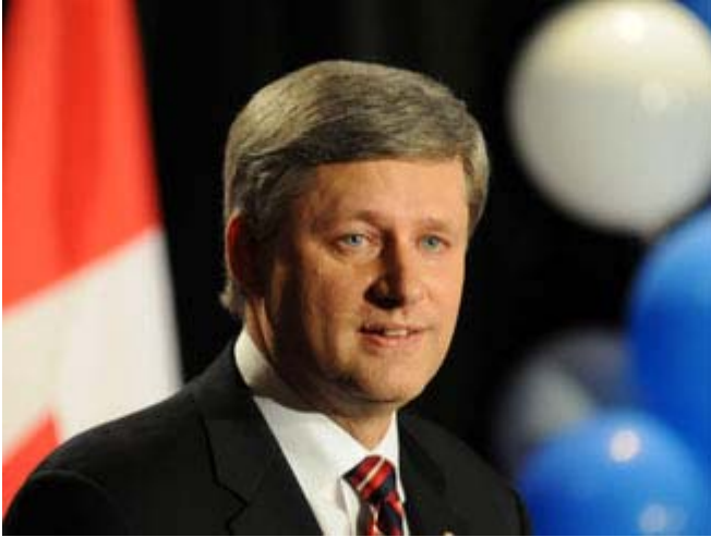
Stephen Harper

Le Premier ministre du Canada, Stephen Harper , se prépare pour des élections prochaines, en juin selon certains observateurs. Le chef du Parti conservateur du Canada visite présentement le pays et il livre un message de ralliement comme on en voit durant une campagne électorale. Il attaque ses adversaires politiques et il met de l'avant ses accomplissements. L'éditeur de LeStudio1.com a observé Stephen Harper lors de l'une de ses récentes conférences à Montréal. Il nous propose un reportage photo de cette rencontre d'un politicien en action devant ses supporters. (Voir site Internet LeStudio1.com)