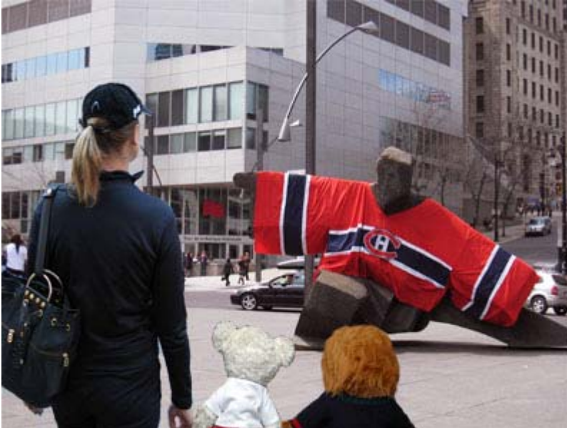
Mademoiselle X et les deux mascottes, Miss Gym et son frère Monsieur X, devant une sculpture géante habillée en gardien de but des Canadiens, rue Viger à Montréal.

«Mieux vaut attraper un torticolis en visant trop haut que de devenir bossu en visant trop bas! -Proverbe