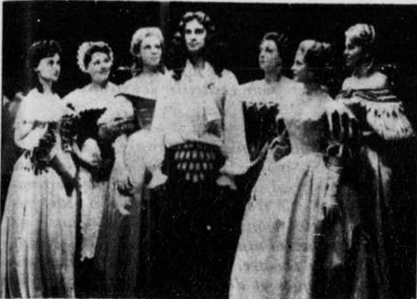
« L'Impromptu de Versailles »