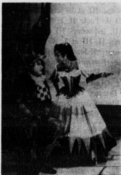
« Les fourberies de Scapin »

Ce fut une soirée exceptionnelle, un spectacle inoubliable comme on n'en voit pas tellement dans sa vie. Peut-être Molière n'a-t-il pas encore été interprété au Canada avec autant de virtuosité. L'assistance fut littéralement hypnotisée par le jeu des acteurs: temps, lieu, entourage, rien n'existait plus hors l'action sur la scène.