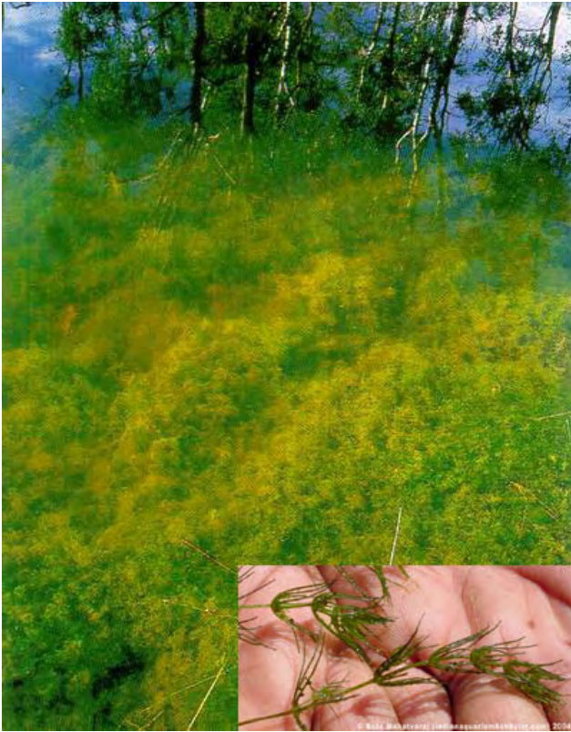
Figure 3 Algue submergée ( Chara )