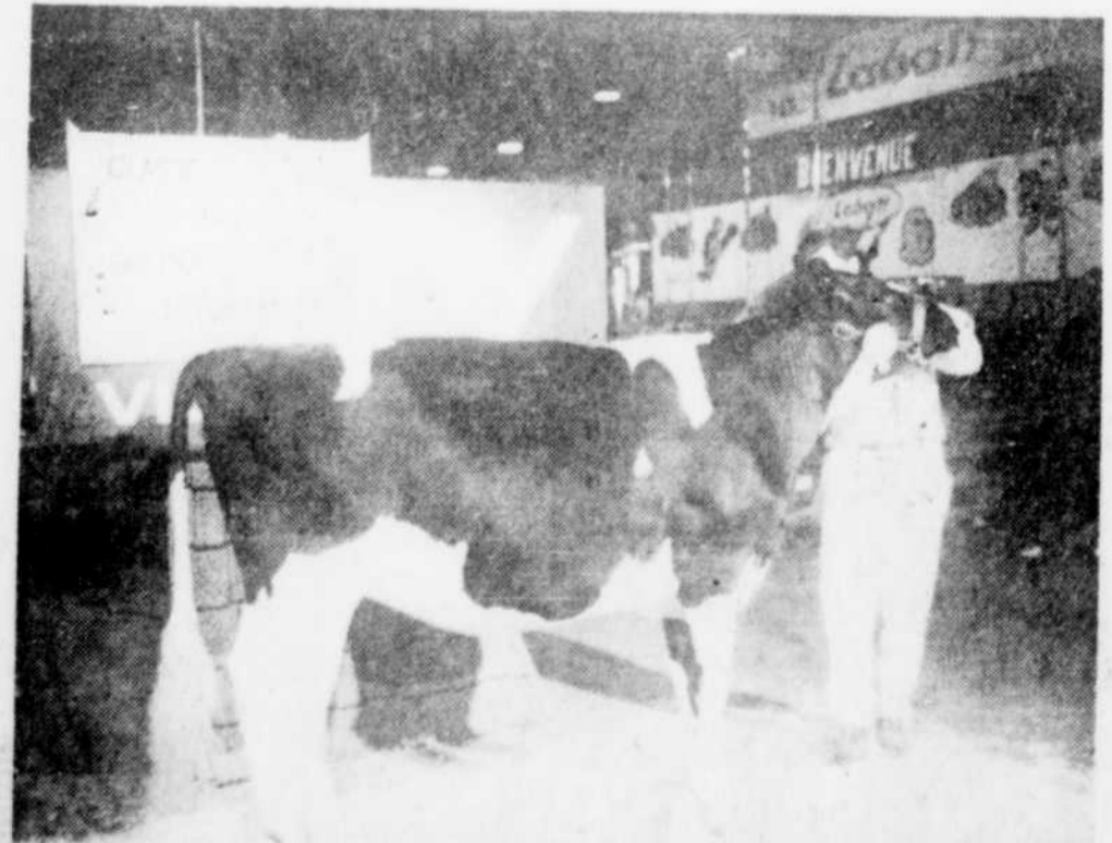
La championne junior Holstein de la 97e exposition régionale de Victoriaville est Clairbois Julie Chieftain Star apparten-