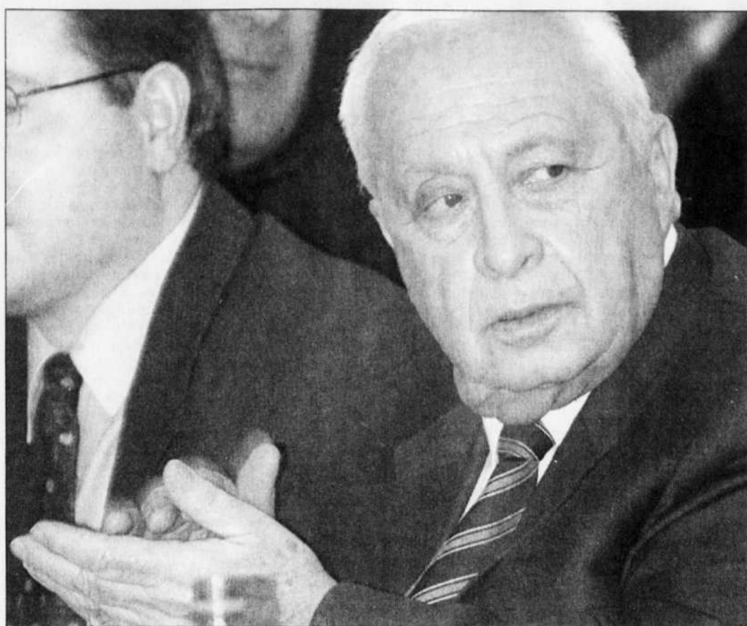
Les Israéliens ont élu comme premier ministre un guerrier, pour faire face à celui des Palestiniens.