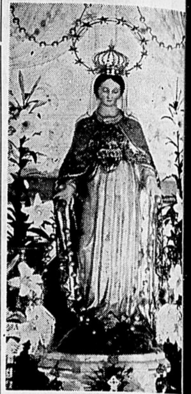
La Madone du Cap que les foules pieuses prient pendant la neuvaine.