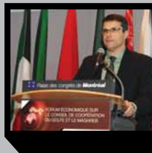
Jean Séguin, sous-ministre adjoint aux affaires économiques internationales, ministère du Développement économique, de l'Innovation et de l'Exportation.

de l'environnement, des transports aéronautiques et des infrastructures aéroportuaires, de l'aluminium, mais aussi des services et solutions d'affaires.