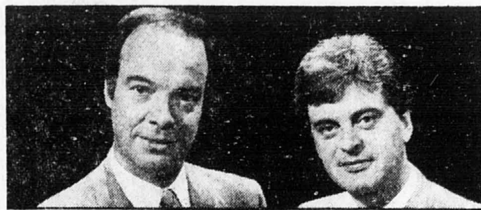
Nadeau et Durivage: un miracle?

Le Point semble donc vouloir renaitre de ses cendres. Comme disait la mère de Napoléon: pourvu que ça dure.