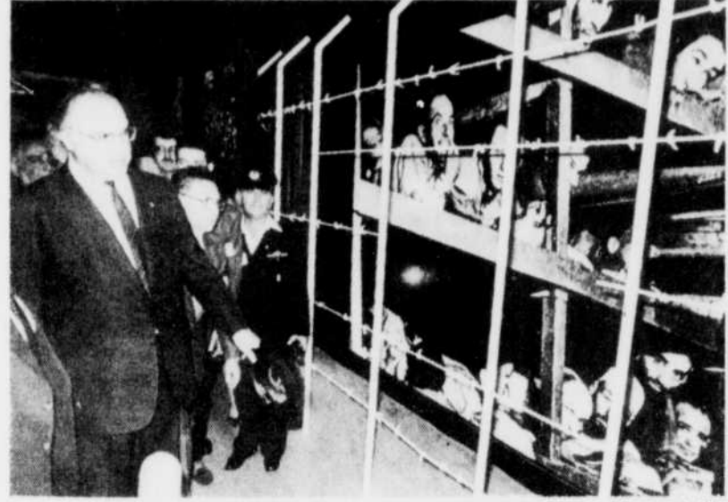
Le chancelier ouest-allemand Helmut Kohl a visité, à Jérusalem, un site remémorant l'holocauste juif qui a marqué la deuxième guerre mondiale.

Il est très important que le peuple allemand et ses dirigeants n'oublient pas. Il faut également qu'ils apprennent à connaître Israël, sa façon de vivre, ses préoccupations, et qu'ils prennent conscience de sa volonté de paix, a ajouté M. Shamir.