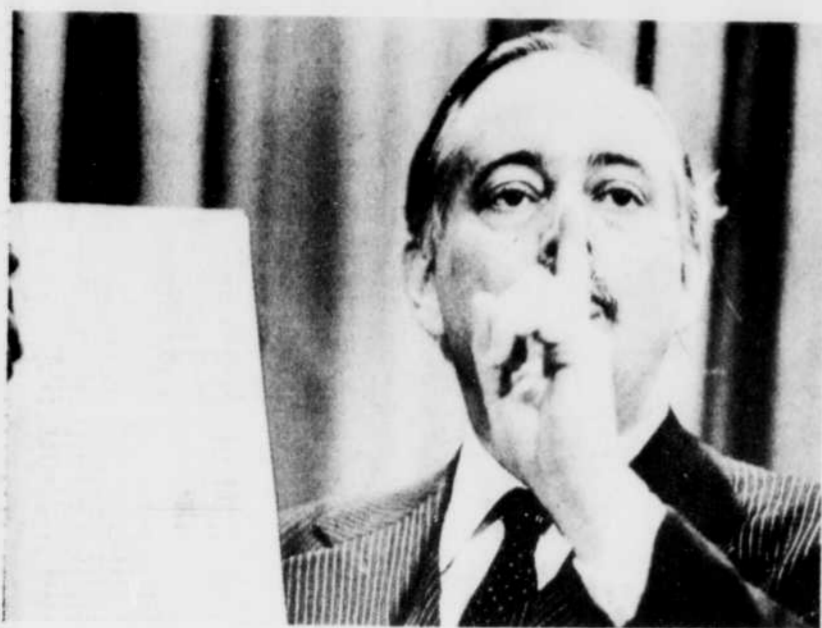
Le ministre des Finances Jacques Parizeau, lors de sa conférence de presse, hier.

Emploi: la méthode de calcul du chef libéral avantagerait le Québec