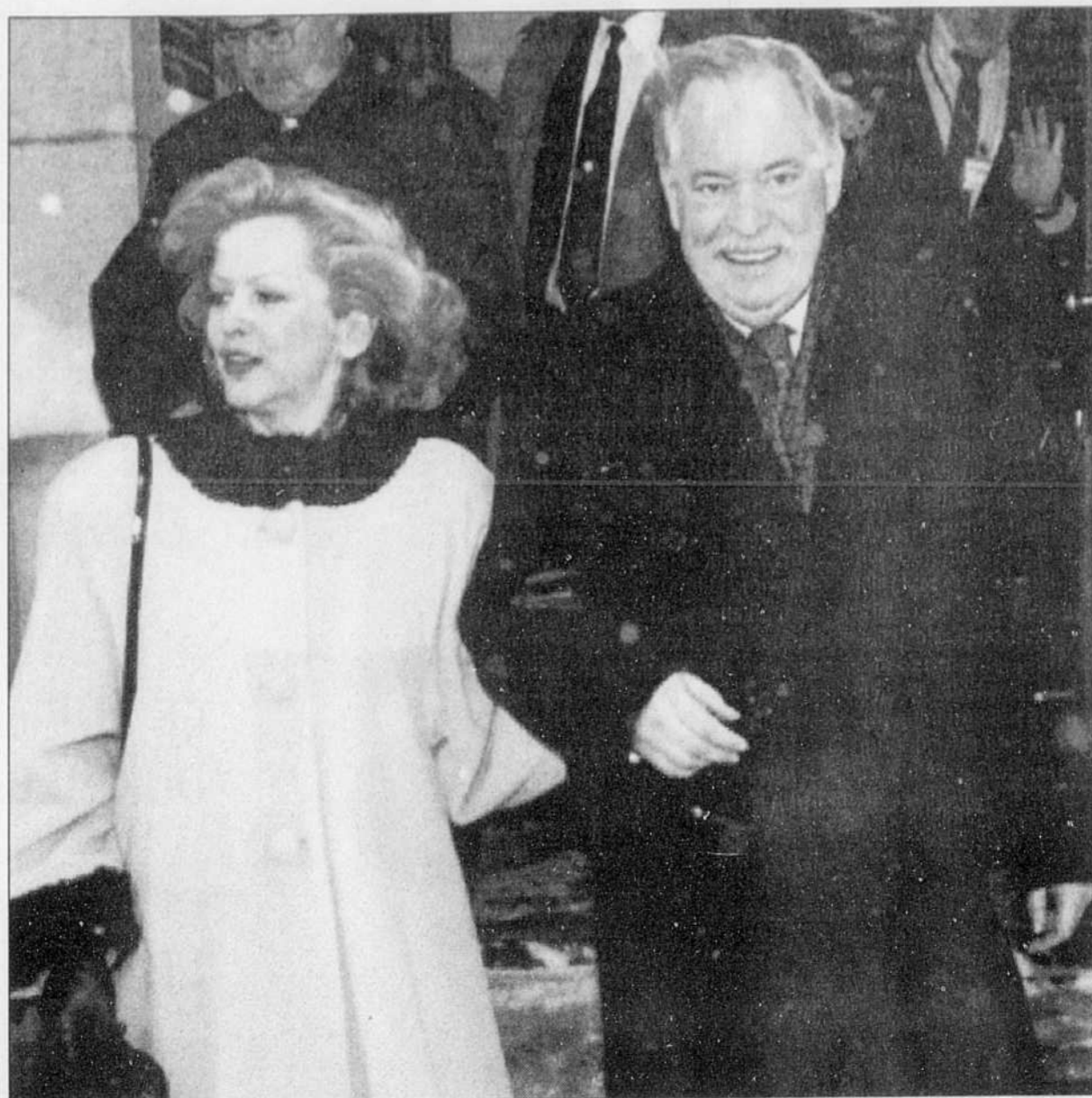
Le premier ministre Jacques Parizeau a dit quitter l'Assemblée nationale avec une satisfaction manifeste de voir «essaimer dans une nouvelle génération» l'objectif de la souveraineté.