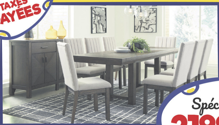
TABLE ET 6 CHAISES REMBOURRÉES 7 morceaux